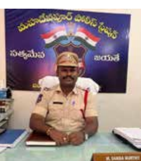
చట్టపరమైన చర్యలు తీసుకోవడంతో పాటు జరిమానాలు విధించడంకాదు అని అవసరమైతే సంబంధిత చట్టాల ప్రకారం కేసులు కూడా నమోదు చేయబడతాయి అని ప్రజలందరూ రహదారి భద్రత విషయంలో బాధ్యతగా వ్యవహరించి పోలీసు శాఖకు సహకరించాలని ఎస్పీ విజ్ఞప్తి చేశారు.

మరీయు నిర్మాణ సామగ్రి చెల్లాలెదురుగా ఉండటం రోడ్డు భద్రతకు తీవ్రమైన ముప్పుగా మారుతున్న అంశమని అందువల్ల పశువుల యజమానులు తమ పశువులను రహదారులపై వదిలి వేయకుండా తగిన జాగ్రత్తలు తీసుకోవాలి అని సూచించారు. అలాగే ఇసుక, కంకర, మట్టి లేదా ఇతర నిర్మాణ సామగ్రిని తరలించే వాహన యజమానులు రోడ్లపై పడకుండా భద్రతా చర్యలు పాటించాలి అని వెల్లడించారు నిబంధనలను కంకరను వదిలి వేయగలిగి ప్రజలకు ఇబ్బందులు కలగకుండా చూడాలి అని వెల్లడించారు నిబంధనలను ఉల్లంఘించి ప్రజల ప్రాణాలకు, ఆస్తులకు ప్రమాదం కలిగిస్తే వ్యక్తులపై