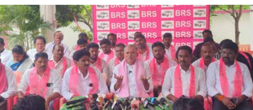
తెలంగాణ రాష్ట్ర పార్లమెంట్ సభ్యులతో జైపూర్ రోడ్డు యొక్క పనులు నిలిచిపోయాయి అని ఆవేదన వ్యక్తం చేశారు భూపాలపల్లి పట్టణంలో అభివృద్ధి మొత్తం మంజూరునగర్ నుండి చెల్వూర్ వైపు వేగంగా అభివృద్ధి చెందుతున్న సందర్భంగా ప్రజల సౌకర్యాన్ని దృష్టిలో ఉంచుకొని వారికోసం మంజూరునగర్ లో ఇంటిగ్రి

విఫలమైందని, రైతులు, యువత, మహిళలు, ఉద్యోగులు, పేద మరీయు మధ్య తరగతి ప్రజలు అనేక ఇబ్బందులు ఎదురవుతున్నారని అన్నారు. అదే విధంగా భూపాలపల్లి జిల్లా ప్రభుత్వ ఆసుపత్రిలో పరిస్థితి అత్యంత దారుణంగా తయారైందని ఆగ్రహం వ్యక్తం చేశారు. పోస్టు మార్కు గడి వద్ద మనుషుల అవయవాలను కుక్కలు పీక్కు తింటున్నాయి. ఇంతకంటే ఘోరం ఎక్కడానూ ఉంటుందని అన్నారు. ప్రభుత్వ ఆసుపత్రిలో కనీస సౌకర్యాలు లేక రోగులు, ప్రజలు అల్లాడుతుంటే ఇక్కడున్న ప్రజా ప్రతినిధులకు కళ్ళు కనబడటం లేదా అని అధికారులు వారు ఏం చేస్తున్నారని అని ఈ వేదికాని నిలిపిస్తున్నారని అన్నా