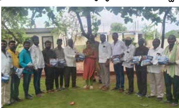
రోని తెలంగాణ ప్రభుత్వం అన్ని వృత్తి వర్గాల అభ్యున్నతే లక్ష్యంగా అనేక సంక్షేమ కార్యక్రమాలు అమలు చేస్తోందని పేర్కొన్నారు. గౌడ సోదరులకు అభివృద్ధి కోసం శిక్షణ కార్యక్రమాలు, భద్రతా పరికరాల పంపిణీ, ఉపాధి అవకాశాల కల్పన వంటి చర్యలను ప్రభుత్వం నిరంతరం కొనసాగిస్తోందన్నారు. కట్లు గీత కార్మికులు ప్రభుత్వం అందించిన రక్ష కిట్లను తప్పనిసరిగా వినియోగిస్తూ భద్రతా నియమాలను పాటించాలని, ప్రాణ భద్రత విషయంలో ఎలాంటి నిర్లక్ష్యం చేయవద్దని ఎమ్మెల్యే సూచించారు. రక్ష కిట్లు అందుకున్న గౌడ సోదరులు ప్రభుత్వం తమ భద్రత

కట్లు గీత కార్మికుల ప్రాణ భద్రతకు తెలంగాణ ప్రభుత్వం అత్యంత ప్రాధాన్యత ఇస్తోందని, వారి సంక్షేమం కోసం అవసరమైన అన్ని చర్యలు చేపడుతున్నామని పాలకర్మి ఎమ్మెల్యే యశస్వినీ రెడ్డి అన్నారు. శుక్రవారం పాలకర్మి మండల కేంద్రంలోని ఎమ్మెల్యే కార్యాలయంలో జిల్లా వెనుకబడిన తరగతుల అభివృద్ధి శాఖ అధ్వర్యంలో శిక్షణ పొందిన కట్లు గీత కార్మికులకు కాటమయ్య రక్ష కిట్లు పంపిణీ కార్యక్రమం నిర్వహించారు. ముఖ్య అతిథిగా హాజరైన ఎమ్మెల్యే యశస్వినీ రెడ్డి అధ్యక్షులు గౌడ సోదరులకు రక్ష కిట్లను అందజేశారు. ఈ సందర్భంగా ఎమ్మెల్యే మాట్లాడుతూ, కట్లు గీత కార్మికుల ప్రతిరోజూ ప్రాణాలను పరంగా పెట్టి చెట్టెక్కి విక్రయిస్తూ నిర్వహిస్తున్నారని, అలాంటి ప్రమాదకర పరిస్థితుల్లో వారి ప్రాణాలను కాపాడేందుకు ప్రభుత్వం ప్రత్యేకంగా కాటమయ్య రక్ష కిట్లను అందించడం ద్వారా, ఈ భద్రతా పరికరాలను ప్రమాదాలను తగ్గించే కార్యక్రమ ప్రాణరక్షణలో కీలక పాత్ర పోషిస్తున్నారని తెలిపారు. ముఖ్యమంత్రి నాయకత్వం