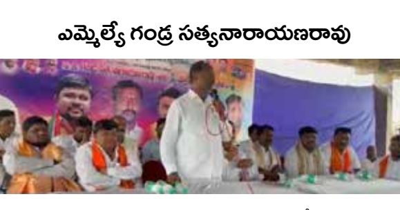
హాణ వ్యయాలు, విడివిడిగా ధరలు, అధన వ్యయం వంటి సమస్యలను ప్రభుత్వం దృష్టికి తీసుకెళ్లి పరిష్కారానికి కృషి చేస్తానని హామీ ఇచ్చారు. అలాగే భూపాలపల్లి నియోజకవర్గం, జిల్లాలో ప్రభుత్వానికి ప్రజాప్రతినిధులకు సంబంధించిన రవాణా అవసరాలు, సరఫరా పనులను సాగించే లాభీ యజమానులతో ప్రాధాన్యత కల్పించే విధంగా తన వంతు ప్రయత్నం చేస్తానని తెలిపారు. భూపాలపల్లి అభివృద్ధిలో భాగంగా గుడిపాపేట్ నుండి భూపాల