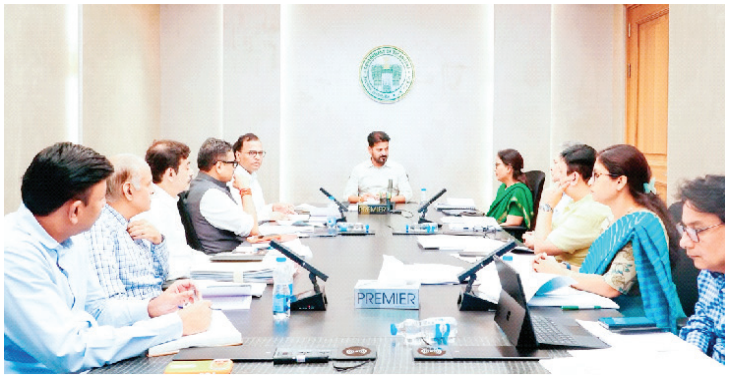
హైదరాబాద్, జులై 7 (పుణ్యం ప్రతినిధి) : పరిపాలనలో మరింత పారదర్శకత కోసం పూర్తిస్థాయిలో కనరత్తు చేసేందుకు వీలుగా ఒక ఉన్నత స్థాయి కమిటీని నియమించాలి అవసరమైన మేరకు చట్టాలను రూపొందించాలి

ప్రభుత్వ ఉద్యోగులు, కాంట్రాక్టు, టెండర్లలో ఉద్యోగులకు 1వ తారీఖున జీతాలు అందించేలా వివరాలన్ని డిజిటలైజ్ లో 4,800 కాంట్రాక్టు, టెండర్లలో ఏజెన్సీలు ఉండగా, ఇందులో 4,300 ఏజెన్సీలు ఉద్యోగులకు ఈఎస్ఐ, పీఎఫ్ చెల్లించడం లేదు ముఖ్యమంత్రి దృష్టికి తీసుకవచ్చిన అధికారులు ఏజెన్సీలకు ప్రభుత్వం చెల్లింపులు చేసినా, ఉద్యోగులకు సమయానికి జీతాలు చెల్లించడం లేదు పూర్తిస్థాయిలో కనరత్తు చేసేందుకు వీలుగా ఒక ఉన్నత స్థాయి కమిటీని నియమించాలి అవసరమైన మేరకు చట్టాలను రూపొందించాలి