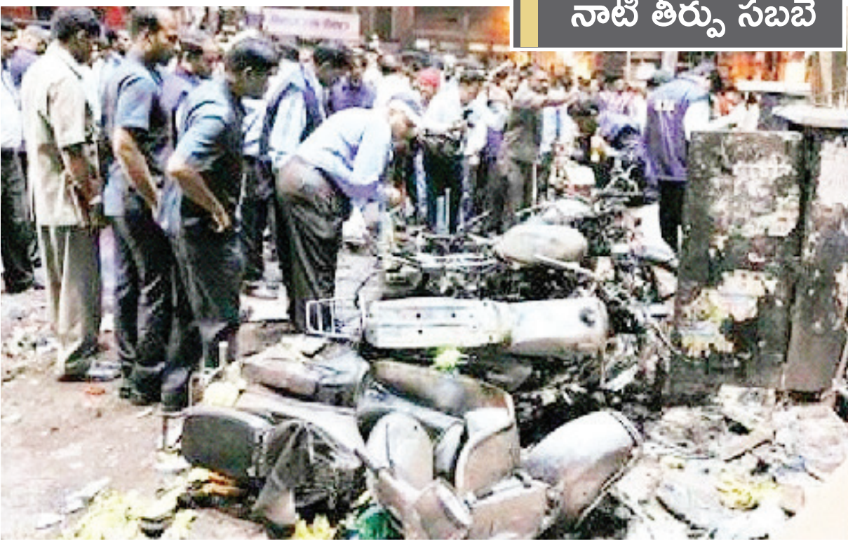
నాటి తీర్పు సబబే