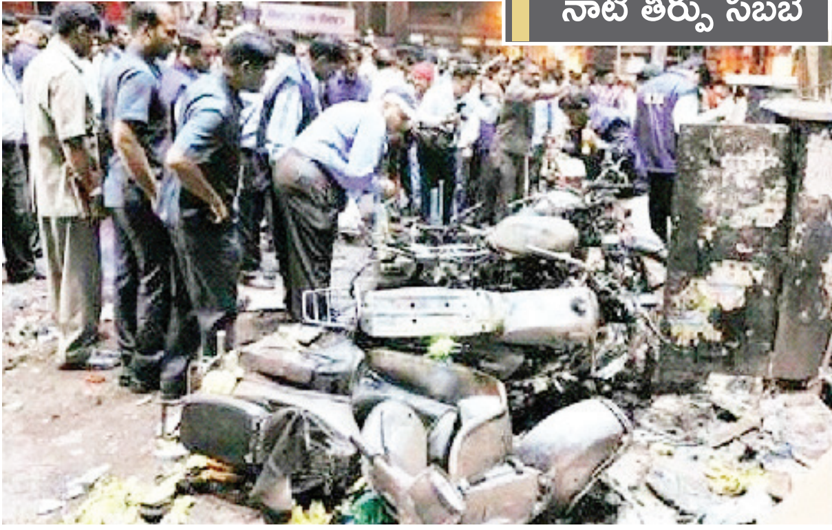
నాటి తీర్పు సబబే

అహ్మదాబాద్ వరుస పేలుళ్ల కేసులో గుజరాత్ హైకోర్టు తీర్పు మరణశిక్షను సమర్థించిన హైకోర్టు మరో 11 మందికి జీవిత ఖైదు ఈ కేసులో 77 మందిపై అభియోగాలు 2008లో అహ్మదాబాద్లో జరిగిన వరుస పేలుళ్లలో 56 మంది మృతి, 200 మందికి గాయాలు అహ్మదాబాద్, జూలై 7 (ఎంఎస్) : అహ్మదాబాద్లో గతంలో జరిగిన వరుస పేలుళ్ల కేసులో గుజరాత్ హైకోర్టు సంచలన తీర్పు ఇచ్చింది. 38 మందికి మరణశిక్ష, 11 మందికి జీవితఖైదు విధిస్తూ 2022లో ప్రత్యేక న్యాయస్థానం ఇచ్చిన తీర్పును సమర్థించింది. కిందికోర్టు ఇచ్చిన తీర్పును సవాలు చేస్తూ దాఖలైన పీటిషన్లను కొట్టివేసింది. ఈ పేలుళ్లలో మృతుల కుటుంబాలకు రూ.10 లక్షలు, గాయపడినవారికి రూ.5 లక్షల పరిహారం ఇవ్వాలని గుజరాత్ ప్రభుత్వాన్ని హైకోర్టు ఆదేశించింది. మార్చి 31, 2027లోగా పరిహారం చెల్లింపులు పూర్తి చేయాలని పేర్కొంది. 2008 జూలై 26న అహ్మదాబాద్లో 21 చోట్ల జరిగిన వరుస పేలుళ్లలో 56 మంది ప్రాణాలు కోల్పోయారు. 246 మంది గాయపడ్డారు. నగరవ్యాప్తంగా అసలుతులు సహా పలుచోట్ల పేలుళ్లు జరగగా రెండ్రోజుల తర్వాత సూరత్లోనూ బాంబులు గుర్తించారు. ఇక పేలుళ్ల శబ్దాలకు సమీపంలో ఉన్నవారు కొంతకాలం విసికిడి శక్తి కోల్పోయారు. దర్యాప్తులో భాగంగా అహ్మదాబాద్ నగర నేరవిభాగం 100 మందిని నిందితులుగా పేర్కొంది. 78 మందిపై విచారణ చేపట్టింది. 2022లో ప్రత్యేక న్యాయస్థానం ఇచ్చిన తీర్పులో 49 మందిని తోపాటుగా నిర్ధరించింది. 28 మందిని నిర్దోషులుగా విడుదల చేసింది. అప్పీళ్లలోగా మారిన ఒక నిందితుడికి క్షమాభిక్ష ప్రసాదించింది. తొలుత ఇచ్చిన వాంగ్మూలాలు ఉపసంహరించుకున్న మరో నలుగురు అప్పీళ్ల వర్షకు శిక్ష విధించింది. మిగతా 2లో