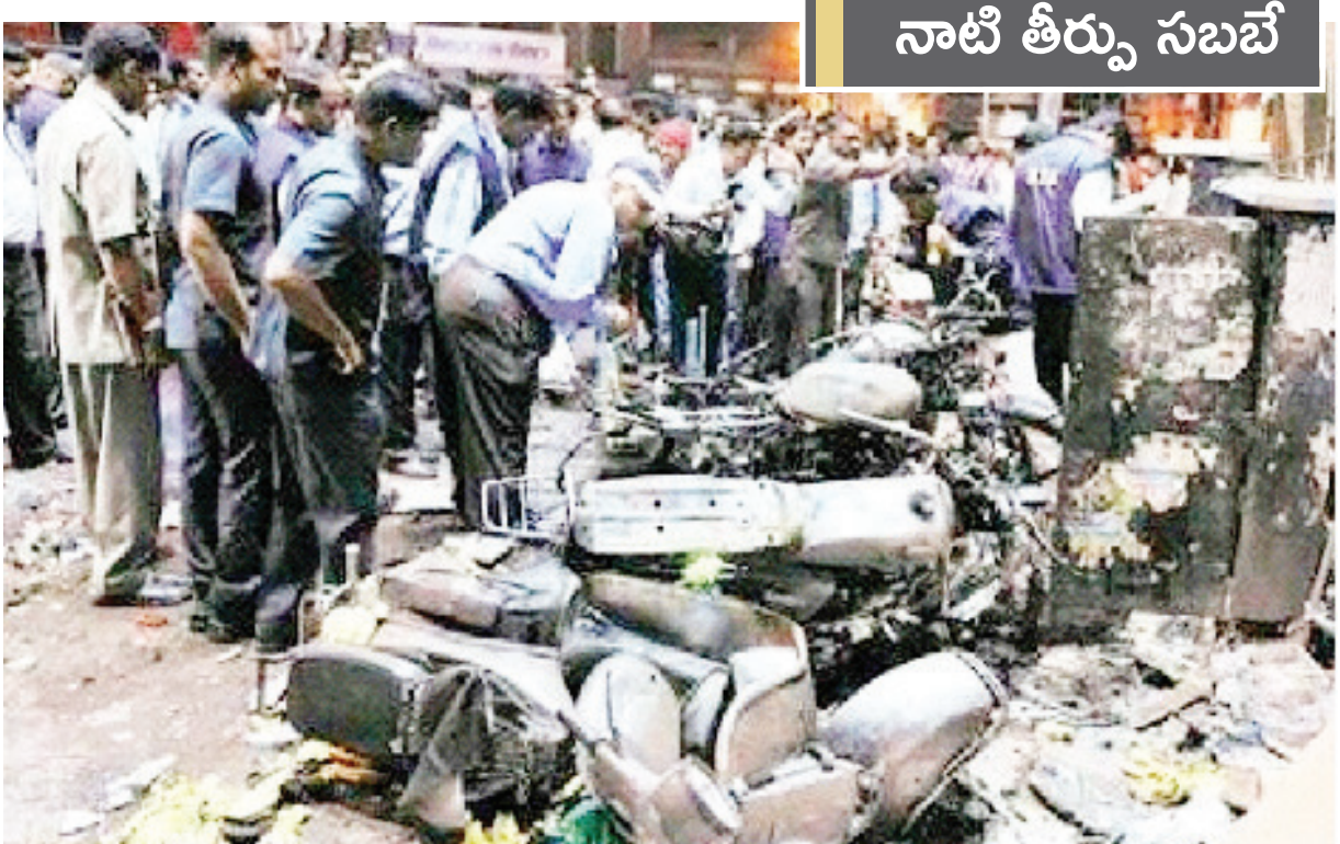
నాటి తీర్పు సబబే