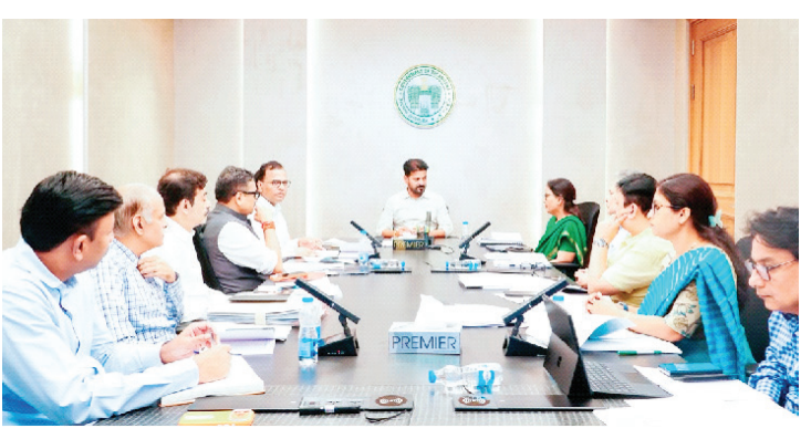
హైదరాబాద్, జూలై 7 (పురయం ప్రతినిధి) : పరిపాలనలో మరింత పారదర్శకత కోసం వ్యవస్థను పూర్తిస్థాయిలో డిజిటలైజ్ చేయాలని ముఖ్యమంత్రి ఎ. రేవంత్ రెడ్డి అధికారులను ఆదేశించారు. రాష్ట్రంలో డిజిటల్ గవర్నెన్స్ దిశగా సమగ్ర ప్రణాళికలను సిద్ధం చేసి అవసరమైన మేరకు చట్టాలను రూపొందించాలని చెప్పారు. రాష్ట్రంలో కాంట్రాక్టు, ఔట్ సోర్సింగ్ ఉద్యోగుల సమస్యలపై ముఖ్యమంత్రి ఎం.ఎస్.ఆర్. హెచ్.ఆర్.డి.లోని డోడ్డి పెవిలియన్లో ఉన్నతాధికారులతో సమీక్షించారు. ప్రజలకు మద్దతుగా సేవలను అందించడంలో పాటు సంక్షేమ పథకాలు నేరుగా లభించాలని చేరే విధంగా డిజిటల్ గవర్నెన్స్ మిగతా 2లో

ప్రభుత్వ ఉద్యోగులు, కాంట్రాక్టు, ఔట్ సోర్సింగ్ ఉద్యోగులకు 1వ తారీఖున జీతాలు అందించేలా వివరాలన్ని డిజిటలైజ్ లో 4,800 కాంట్రాక్టు, ఔట్ సోర్సింగ్ ఏజెన్సీలు ఉండగా, ఇందులో 4,300 ఏజెన్సీలు ఉద్యోగులకు ఈఎస్ఎస్, పీఎఫ్ చెల్లించడం లేదు ముఖ్యమంత్రి దృష్టికి తీసుకవచ్చిన అధికారులు ఏజెన్సీలకు ప్రభుత్వం చెల్లింపులు చేసినా, ఉద్యోగులకు సమయానికి జీతాలు చెల్లించడం లేదు పూర్తిస్థాయిలో కనరత్తు చేసేందుకు వీలుగా ఒక ఉన్నత స్థాయి కమిటీని నియమించాలి అవసరమైన మేరకు చట్టాలను రూపొందించాలి