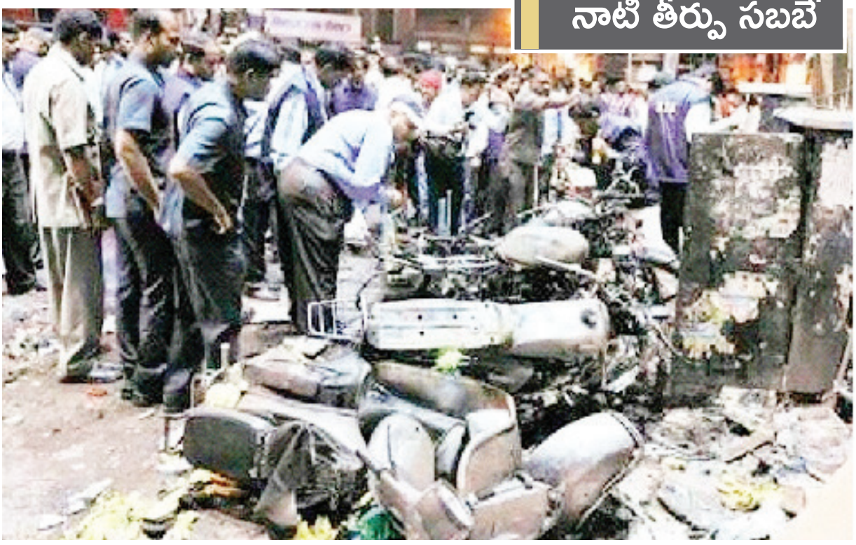
నాటి తీర్పు సబబే