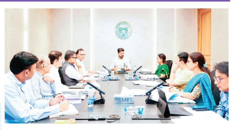
హైదరాబాద్, జులై 7 (పుడయం ప్రతినిధి) : పరిపాలనలో మరింత పారదర్శకత కోసం వ్యవస్థ పూర్తిస్థాయిలో డిజిటలైజ్ చేయాలని ముఖ్యమంత్రి ఎ. రేవంత్ రెడ్డి అధికారులను ఆదేశించారు. రాష్ట్రంలో డిజిటల్ గవర్నెన్స్ పథకాలు నేరుగా అధికారులకు చేరే విధంగా రమైన మేరకు చట్టాలను రూపొందించాలని చెప్పారు. రాష్ట్రంలో కాంట్రాక్టు, ఔట్ సోర్సింగ్ ఉద్యోగుల సమస్యలపై ముఖ్యమంత్రి ఎం.ఎస్.ఆర్. హెచ్.ఆర్.ఎస్.లోని బోర్డు సెలెక్షన్లలో ఉన్నతాధికారులతో సమీక్షించారు. ప్రజలకు మెరుగైన సేవలను అందించడంలో పాలు సంతకేమ పథకాలు నేరుగా అధికారులకు చేరే విధంగా డిజిటల్ గవర్నెన్స్ మిగతా 2లో

ప్రభుత్వ ఉద్యోగులు, కాంట్రాక్టు, ఔట్ సోర్సింగ్ ఉద్యోగులకు 1వ తారీఖున జీతాలు అందించేలా వివరాలన్ని డిజిటలైజ్ లో 4,800 కాంట్రాక్టు, ఔట్ సోర్సింగ్ ఏజెన్సీలు ఉండగా, ఇందులో 4,300 ఏజెన్సీలు ఉద్యోగులకు ఈఎస్ఐ, పీఎఫ్ చెల్లించడం లేదు ముఖ్యమంత్రి దృష్టికి తీసుకవచ్చిన అధికారులు ఏజెన్సీలకు ప్రభుత్వం చెల్లింపులు చేసినా, ఉద్యోగులకు సమయానికి జీతాలు చెల్లించడం లేదు పూర్తిస్థాయిలో కనరత్తు చేసేందుకు వీలుగా ఒక ఉన్నత స్థాయి కమిటీని నియమించాలి అవసరమైన మేరకు చట్టాలను రూపొందించాలి