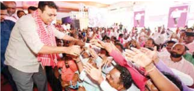
మల్లాపూర్, హైదరాబాద్, జూలై 6 (పురయం ప్రతినిధి) : మీరు వద్ద బస్తాలు మోసి కష్టపడ్డారు.. ఢిల్లీలో మూటల కోసం రేవంత్ కష్టపడుతున్నాడు బిల్ ఎన్ పార్టీని బడ్జెట్ చేయడమే రేవంత్ రెడ్డి లక్ష్యం ఇవాళ నీళ్లు ఉన్నా.. మన పంటలను ఎండబెడుతున్నాడు మరోవైపు లక్ష క్యూసెక్కుల నీళ్లు వృధాగా పోతున్నాయి కాళేశ్వరం ప్రాజెక్టు వల్ల సుభాక్షవైతది, దయచేసి ఆ పని చెయ్యే అంటే చేస్తలేదు మా మీద కోపం రైతుల మీద తీయొద్దు రాష్ట్ర ప్రభుత్వానికి విన్నవించినం బిల్ ఎన్ వర్కంగ్ ప్రసిడెంట్ కెటిఆర్

మీరు వద్ద బస్తాలు మోసి కష్టపడ్డారు.. ఢిల్లీలో మూటల కోసం రేవంత్ కష్టపడుతున్నాడు బిల్ ఎన్ పార్టీని బడ్జెట్ చేయడమే రేవంత్ రెడ్డి లక్ష్యం ఇవాళ నీళ్లు ఉన్నా.. మన పంటలను ఎండబెడుతున్నాడు మరోవైపు లక్ష క్యూసెక్కుల నీళ్లు వృధాగా పోతున్నాయి కాళేశ్వరం ప్రాజెక్టు వల్ల సుభాక్షవైతది, దయచేసి ఆ పని చెయ్యే అంటే చేస్తలేదు మా మీద కోపం రైతుల మీద తీయొద్దు రాష్ట్ర ప్రభుత్వానికి విన్నవించినం బిల్ ఎన్ వర్కంగ్ ప్రసిడెంట్ కెటిఆర్