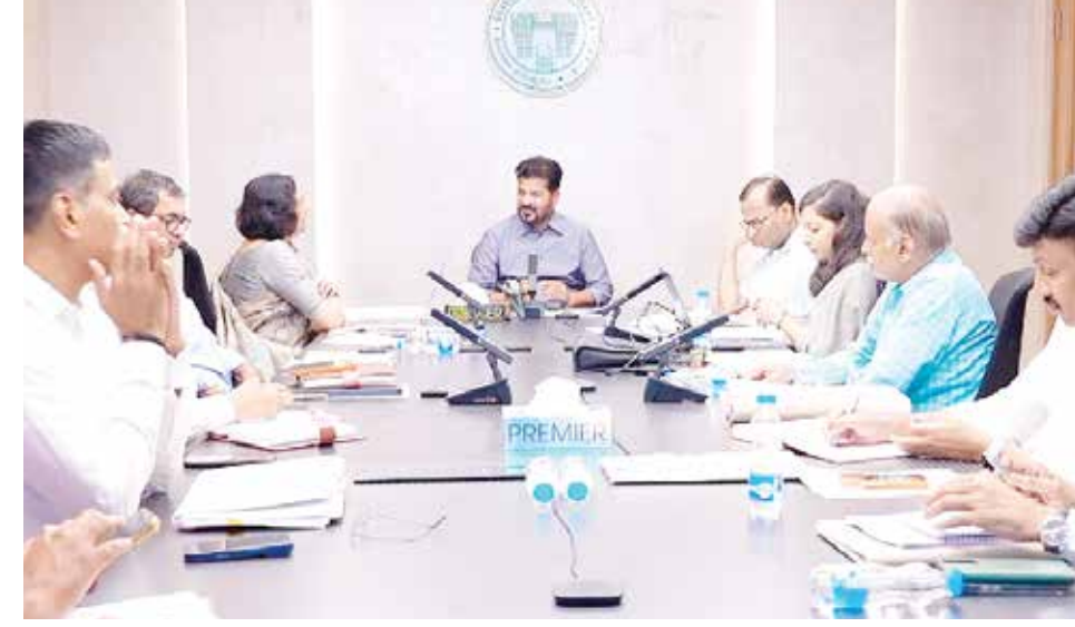
అధికారులతో కలిసి సమీక్ష నిర్వహిస్తున్న ముఖ్యమంత్రి రేవంత్ రెడ్డి

దుర్గం చెరువును పూర్తి స్థాయి పర్యాటక ప్రాంతంగా తీర్చిదిద్దాలి ఘోకన్ సీటీ పరిధిలోని అటవీ భూముల్లో అంతర్జాతీయ స్థాయిలో పర్యాటక ప్రాంతాలు చేయాలి గుర్తంగూడ ఎకో పార్క్ తరహాలో నగరంలో ఎకో పార్కులుగా తీర్చిదిద్దాలి పురానాపూర్ వంటి వారసత్వ సంపదగా నిలిచిన బ్రెడ్జిలను అభివృద్ధి చేయాలి పనులను వేగవంతం చేయడానికి పర్యాటక శాఖపై సిఎం రేవంత్ రెడ్డి ఉన్నతస్థాయి సమావేశం అవసరమైన ప్రణాళికలు రూపొందించి అమలు చేయాలని అధికారులకు ఆదేశం