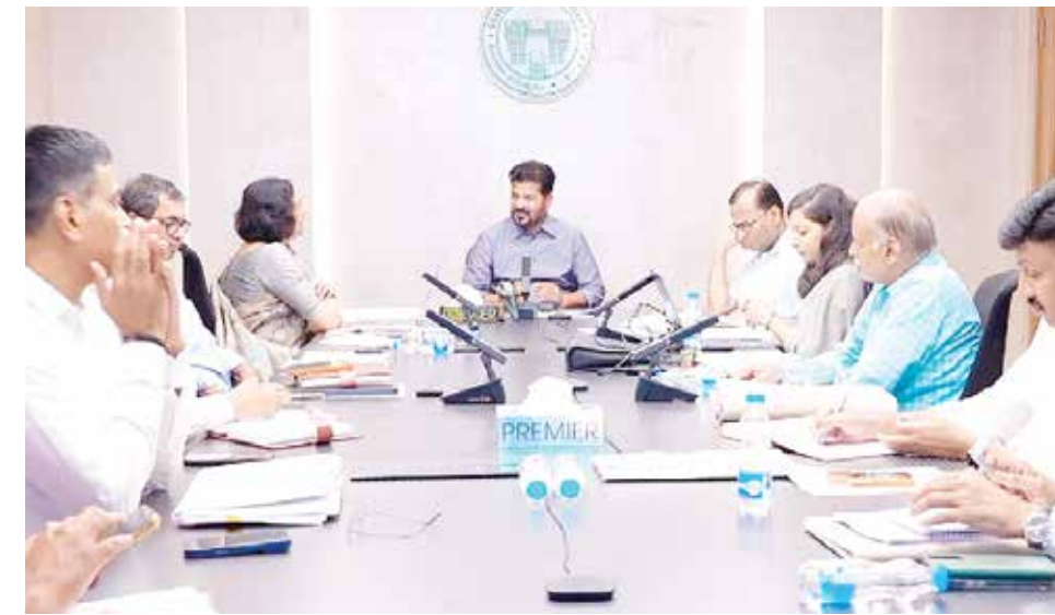
అధికారులతో కలిసి సమీక్ష నిర్వహిస్తున్న ముఖ్యమంత్రి రేవంత్ రెడ్డి

ప్యూచర్ సిటీ పరిధిలోని అటవీ భూముల్లో అంతర్జాతీయ స్థాయిలో పర్యాటక ప్రాంతాలు చేయాలి గుర్లంగూడ ఎకో పార్క్ తరహాలో నగరంలో ఎకో పార్కులుగా తీర్చిదిద్దాలి పురానాపూల్ వంటి వారసత్వ సంపదగా నిలిచిన బ్రిడ్జిలను అభివృద్ధి చేయాలి పనులను వేగవంతం చేయడానికి పర్యాటక శాఖపై సిఎం రేవంత్ రెడ్డి ఉన్నతస్థాయి సమావేశం అవసరమైన ప్రణాళికలు రూపొందించి అమలు చేయాలని అధికారులకు ఆదేశం