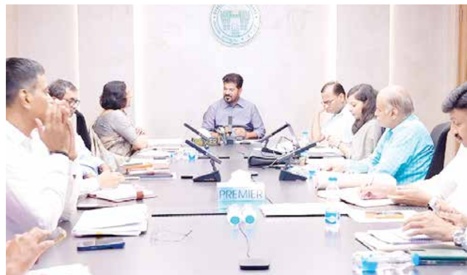
అధికారులతో కలిసి సమీక్ష నిర్వహిస్తున్న ముఖ్యమంత్రి రేవంత్ రెడ్డి

పూర్వ సీటీ పరిధిలోని అటవీ భూముల్లో అంతర్జాతీయ స్థాయిలో పర్యాటక ప్రాంతాలు చేయాలి గుర్తంగూడ ఎకో పార్క్ తరహాలో నగరంలో ఎకో పార్కులుగా తీర్చిదిద్దాలి పురానాపూల్ వంటి వారసత్వ సంపదగా నిలిచిన బ్రిడ్జిలను అభివృద్ధి చేయాలి పనులను వేగవంతం చేయడానికి పర్యాటక శాఖపై సిఎం రేవంత్ రెడ్డి ఉన్నతస్థాయి సమావేశం అవసరమైన ప్రణాళికలు రూపొందించి అమలు చేయాలని అధికారులకు ఆదేశం