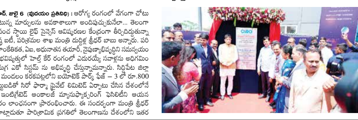
హైదరాబాద్, జూలై 6 (పుడయం ప్రతినిధి) : అలోగ్య రంగంలో వేగంగా చోటు చేసుకుంటున్న మార్పులను అవకాశాలుగా అందిస్తున్నామనా... తెలంగాణను ప్రపంచ స్థాయి లైఫ్ సైన్సెస్ ఆవిష్కరణల కేంద్రంగా తీర్చిదిద్దుతున్నామని రాష్ట్ర ఐటీ, పరిశ్రమల శాఖ మంత్రి దుద్దిళ్ల శ్రీధర్ బాబు అన్నారు. పరిశోధన, సాంకేతికత, ఏజి, అధునాతన తయారీ, నైపుణ్యాభివృద్ధిని సమన్వయం చేస్తూ... భవిష్యత్తులో హెల్త్ కేర్ రంగంలో ఎదురయ్యే సవాళ్లను అధిగమించేలా సమగ్ర ఎకో సిస్టమ్ ను అభివృద్ధి చేస్తున్నామన్నారు. సిద్దిపేట జిల్లా మర్చూక్ మండలం కరకపట్టంలో బయోటెక్ పార్క్ ఫేజ్ - 3 లో రూ.800 కోట్ల పెట్టుబడితో సీఆర్ పార్క్ ప్రైవేట్ లిమిటెడ్ ఏర్పాటు చేసిన దేశంలోనే మొదటి ఇంటిగ్రేటెడ్ ఆంకాలజీ మ్యానుఫ్యాక్చరింగ్ ఫెసిలిటీని ఆయన సోమవారం లాంచ్మెంట్ ప్రారంభించారు. ఈ సందర్భంగా మంత్రి శ్రీధర్ బాబు మాట్లాడుతూ పారిశ్రామిక ప్రగతిలో తెలంగాణను దేశంలోని ఇతర

పారిశ్రామిక ప్రగతిని చూసి ఓర్యలేకే ప్రతిపక్షాల దుష్ప్రచారం ప్రజలను తప్పుదోవ పట్టించేలా అదే పనిగా మాపై బురద చల్లుతున్నారు దేశంలోనే మొదటి ఇంటిగ్రేటెడ్ ఆంకాలజీ మ్యానుఫ్యాక్చరింగ్ ఫెసిలిటీ ప్రారంభోత్సవంలో మంత్రి శ్రీధర్ బాబు తెలంగాణ నుంచే ఒక కొత్త మాలి క్యూల్ ఆవిష్కృతం కావాలి జోన్ గా తీర్చిదిద్దేందుకు ప్రత్యేక కార్యాచరణ రూపొందించాము కొత్తగా 500 మందికి ప్రత్యక్షంగా ఉపాధి అవకాశాలు కల్పిస్తాం