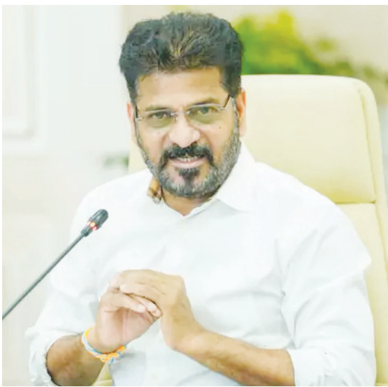
హైదరాబాద్, జూలై 5 (పుడయం) :

ఖమ్మం 06-07-2026 సోమవారం సంపుటి : 13 | సంచిక : 348 SINCE 25 YEARS CIRCULATED TELUGU DAILY రూ. 1.00 | పేజీలు : 12 VOODAYAM Telugu DAILY Simultaneously published from Khammam, Hyderabad, Adilabad, Karimnagar, Guntur & Warangal Follow us on