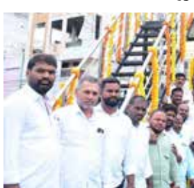
సంగారెడ్డి, జూలై 4: పుడయం.

తెలంగాణ సాయుధ రైతాంగ పోరాట తొలి అమరుడు దొడ్డి కొమరయ్య పరం తిని పురస్కరించుకొని శనివారం జిల్లా వెనుకబడిన తరగతుల సంక్షేమ శాఖ అధ్యక్షుల సంగారెడ్డి పట్టణంలోని పోలి