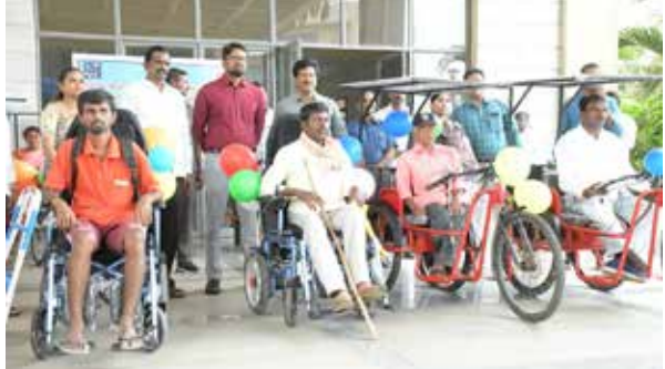
వనపర్తి జూలై 4 (పుడయం ప్రతినది)