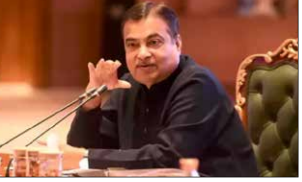
చమురు దిగుమతులను తగ్గించుకోవచ్చు. విదేశీ మారక ప్రయత్నం ఆదా అవుతుంది. పంట వ్యర్థాల నుంచి ఐసోబ్యుటనాల్ ను ఉత్పత్తి చేయొచ్చు కాబట్టి.. రైతులూ అదనపు ఆదాయాన్ని అర్జిస్తారు.

ఉద్యోగాలు వెలుపడటం, ఇంజనీ నాణ్యత మెరుగుపడడం ఇందుకు కారణం. దీంతో దేశీయంగా జీవ ఇంధనం ఉత్పాదన పెరగడంతో