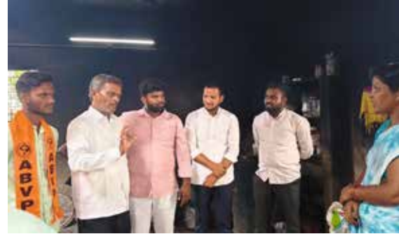
నారాయణపేట జూలై 4 (పుడయం ప్రతినది)

మధ్యాహ్న భోజన పరిశీలన కార్యక్రమంలో భాగంగా నారాయణపేట పట్టణంలోని గ్రౌండ్ స్కూల్ ప్రభుత్వ ఉన్నత పాఠశాలలో అఖిల భారత విద్యార్థి పరిషత్ నాయకులు శనివారం మిడ్ డే ను పరిశీలించారు. దాదాపు 800 మంది విద్యార్థులు ఉన్న పాఠశాలలో సగానికి పైగా మధ్యాహ్న భోజనానికి టిఫిన్ విద్యార్థులు ఇంటి నుండి తీసుకురావడం, అదేవిధంగా ఏ ఒక్క విద్యార్థికి కూడా కావాల్సినంత