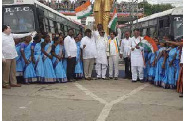
వెల్లూరు జూలై 4 (పుడయం)