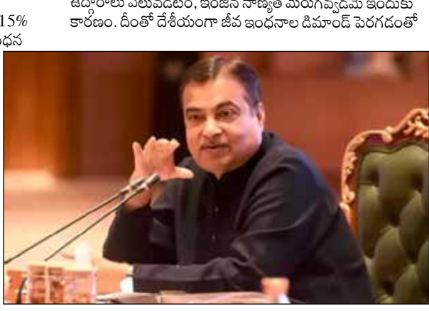
ఉద్ధారాలు వెలుపడటం, ఇంజనీ నాణ్యత మెరుగుపడడం ఇందుకు కారణం. దీంతో దేశీయంగా జీవ ఇంధనం ఉత్పాదన పెరగడంతో

చమురు దిగుమతుల భారాన్ని తగ్గించేందుకు కేంద్రం మరో ప్రయత్నం చేస్తోంది. డిజిల్ లో 15 శాతం ఐసోబ్యుటనాల్ (15% isobutanol) కలపడంపై దృష్టి సారించింది. దేశంలో ఇంధన భద్రతను మెరుగుపరచేందుకు, రవాణా రంగంలో కర్తవ్య ఉద్ధారాలను తగ్గించేందుకు ఇది దోహదపడుతుందని కేంద్రం భావిస్తోంది. ఈ మేరకు ప్రత్యామ్నాయ ఇంధన వ్యూహంపై కేంద్ర రోడ్డు, రవాణా శాఖ మంత్రి సీతీన్ గడ్కర్ వ్యాఖ్యానించారు. డిజిల్ తో ఇథనాల్ ను నేరుగా కలపడం సాధ్యం కాదు. అందుకే ఇథనాల్ నుంచి ఐసోబ్యుటనాల్ తయారీకి కృషి చేస్తున్నాం. ఇది డిజిల్ కు ప్రత్యామ్నాయంగా మారుతుంది. డిజిల్ లో 15 శాతం ఐసోబ్యుటనాల్ కలపడం ప్రభుత్వం పనిచేస్తోంది. ఇంధనం స్వయం సమృద్ధికి ఇది కీలక అడుగుగా మారనుంది" అని ఆయన అన్నారు. ఇందుకు సంబంధించిన పైలెట్ ప్రాజెక్టు కూడా ప్రోత్సాహకర ఫలితాలు ఇచ్చిందన్నారు. 100 శాతం ఇథనాల్, ఐసోబ్యుటనాల్ తో సడిచే రెండు రకాల ఇంధనాలను తయారు చేశామని, ఇందుకు ఇంజనీలు కూడా సహకృత్యం చేసారు. కాగా, భవిష్యత్తు జీవ ఇంధనంగా ఐసోబ్యుటనాల్ మారనుందని సంబంధిత అధికారులు అభిప్రాయించారు. ఇతర ఐసోబ్యుటనాల్ కంటే తక్కువ కర్బన