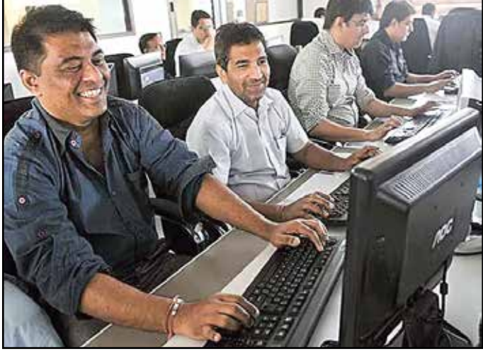
బజాజ్ ఫిన్సెన్స్ 2.13%, టెక్ మహింద్రా 1.81%, భారతీ ఎయిర్టెల్ 1.81%, సన్ ఫిన్సెన్స్ 1.77%, అలాబెక్ సిమెంట్ 1.62% పెరిగాయి. యాక్సిస్ బ్యాంక్ 1.56%, ఎన్ఐఐ 1.13%, మహింద్రా పెరిగి 95.18 వద్ద ముగిసింది. బ్యాంకెట్ 1.11%, ఎల్ఐఐటీ 0.83% వద్దపోయాయి. బీఎన్ఈ రంగాల నూచిల్ స్పిరాన్, ఐటీ, ఆరోగ్య సంరక్షణ, కమ్యూనిటీస్, లోహ, టెలికాం రాజీవ్ గా... విద్యుత్, భారీ యంత్రపరికరాలు, ఇంధనయంత్రాలు, వాహనాల దిలపడాయి. బీఎన్ఈలో 2,257 కంపెనీల షేర్లు లాభాల్లో: 1,986 కంపెనీల షేర్లు నష్టాల్లో ముగిసాయి. 198 కంపెనీల షేర్ల ధరలో మార్పు లేదు. మన విదేశీ మారకపు నిల్వలు జూన్ 26వో ముగిసిన వారంలో 5.654 బిలియన్ డాలర్ల తగ్గి 666.933 బిలియన్ డాలర్ల వద్ద పరిమితమయ్యాయి. రిజర్వ్ బ్యాంక్ ఆఫ్ ఇండియా (ఆర్బీఐ) తెలిపింది. విదేశీ మారకపు నిల్వల్లో కీలకమైన విదేశీ కరెన్సీ ఆస్తులు 150 బిలియన్ డాలర్ల తగ్గి 541.067 బిలియన్

మరుసటి రోజూ మన సాకీ మార్కెట్ లాభాల్లో ముగిసాయి. ఐటీ షేర్లలో కొనుగోళ్లు ఇందుకు దోహదం చేశాయి. అమెరికా డిబ్బోగ్ గణాంకాలు అంచనాల కంటే తక్కువగా నమోదైనందున, సమీపకాలంలో ఆ దేశ కేంద్ర బ్యాంకు వడ్డీ రేట్లు పెంచకపోవచ్చనే అంచనాలు.. మన మార్కెట్ నుండి మెంట్ బలపడటానికి దోహదం చేశాయి. దాలతో పోలిస్తే రూపాయి మారకపు విలువ 17 పైనులు పెరిగి 95.18 వద్ద ముగిసింది. బ్యారెట్ థ్రెంట్ ముమ్మడి చమురు ధర 0.14% పెరిగి 71.94 డాలర్ల వద్ద ట్రేడవు తోంది. ఆసియా మార్కెట్లన్నీ లాభాల్లో ముగియగా.. ఐరోపా మార్కెట్ల సానుకూల ధోరణిలోనే ఆరంభమయ్యాయి. బీఎన్ఈలోని నమోదిత కంపెనీల మార్కెట్ విలువ రూ. 39,000 కోట్లు పెరిగి రూ. 480.19 లక్షల కోట్ల (5.04 లక్షల కోట్ల డాలర్ల)కు చేరింది. తగ్గిన లాభాలు.. ఉదయం బీఎన్ఈ సెన్సెక్స్ 78,152.34 పాయింట్ల వద్ద లాభాల్లో ఆరంభమైంది. ఆ తర్వాత ఒడుదొడుకుల మధ్య సూచీ కదలా దింది. మధ్యాహ్నం తర్వాత లాభాలు తగ్గుతూ వచ్చినా, చివరకు 261.79 పాయింట్ల లాభంతో 77,763.91 పాయింట్ల వద్ద ముగిసింది. సిఫ్టీ 95.15 పాయింట్లు పెరిగి 24,270.85 పాయింట్ల వద్ద స్థిరపడింది. ఇంక్లూడ్ లో 24,252.35 పాయింట్ల వద్ద కనిష్టస్థాయి: 24,378.15 పాయింట్ల వద్ద గరిష్టస్థాయి నమోదుచేసింది. వారం మొత్తం మిన సెన్సెక్స్ 663 పాయింట్లు, సిఫ్టీ 215 పాయింట్లు పెరిగాయి. సెన్సెక్స్ 30 కంపెనీల షేర్లలో 12 మినహా మిగతావి లాభాల్లో ముగిసాయి. హెచ్ఎన్టీ టెక్ 5.79%,