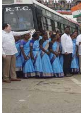
వైఎస్ఆర్ జూలై 4 (పుడయం)