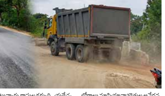
జూలై 04 (పుడయం బ్యూరో)

జోగులాంబ గద్వాల జిల్లాలో 'మట్టి' మహిళా చెలరేగిపోతోంది. ప్రభుత్వ ఆస్తిని కాపాడాల్సిన రక్షక బల 'మామూళ్' మత్తులో జోగులాంబలోని తో అక్రమార్కులు ఏకంగా కాలవలనే తప్పకస్తారు. ధర్మం మందలం జాంబల్లి గ్రామ శివారులోని ర్యాలంపాడు రిజర్వాయర్ గ్రామీణి కాలువపై అక్రమంగా దోపిడీ దారులను అణచివేస్తున్నామని తెలిపారు. గత వారం రోజులుగా ఇక్కడి ప్రభుత్వ మట్టిని కొట్ట గొడుతు. కొట్ట రూపాయల ప్రజాధనాన్ని అక్రమార్కులు తమ జేబుల్లో నింపుతున్నారు. కాలువ కక్కుర్తి.. యథేచ్ఛగా తరలింపు నియమ నిబంధనలను దాడిలో పోసిన రేపగు చేస్తూ, పగలు రాత్రి తేడా లేకుండా యంత్రాలతో తప్పకస్తారు. వందలాది టిప్పర్ల ద్వారా ఈ మట్టిని ధర్మం, జీవీఎస్ పండ్లపావుల ఏకంగా గద్వాల పట్టణంలోని ప్రైవేట్ వెంచర్లకు, భారీ గొప్ప నిర్మాణాలకు తరలింపు సౌము చేసుకుంటున్నారు. ఇంత బెహిరంగం తో అక్రమార్కులు మైసింగ్, ఇరిగేషన్, రెవెన్యూ శాఖల కట్ట మూసకో వదం వెనుక ఉన్న 'సహకారం' ఏంటో అర్థం కాక స్థానికులు ముక్కున వేలే సుకుంటున్నారు. త్యాగాలు రైతులవి..