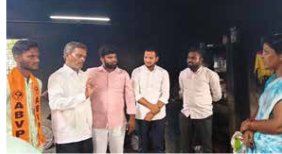
నారాయణపేట జూలై 4 (పుడయం ప్రతినది)