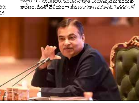
ఉధారాలు వెలుపడటం, ఇంజనీలు నాణ్యత మెరుగ్చేడమే ఇందుకు కారణం. దీంతో దేశీయంగా జీవ ఇంధనం ఉత్పాదన పెరగడంతో చమురు దిగుమతులను తగ్గించుకోవచ్చు. విదేశీ మారక ప్రయత్నం ఆదా అవుతుంది. పంట వ్యర్థాల నుంచి ఐసోబ్యుటనాల్ ను ఉత్పత్తి చేయొచ్చు కాబట్టి.. రైతులూ అదనపు ఆదాయాన్ని అర్జిస్తారు.

చమురు దిగుమతుల భారాన్ని తగ్గించేందుకు కేంద్రం మరో ప్రయత్నం చేస్తోంది. డిజిల్ లో 15 శాతం ఐసోబ్యుటనాల్ (15% isobutanol) కలపడంపై దృష్టి సారించింది. దేశంలో ఇంధన భద్రతను మెరుగ్చేయడం, రవాణా రంగంలో కర్తవ్య ఉద్యోగాలను తగ్గించేందుకు ఇది దోహదపడుతుందని కేంద్రం భావిస్తోంది. ఈ మేరకు ప్రత్యామ్నాయ ఇంధన వ్యూహంపై కేంద్రం రోడ్డు, రవాణా శాఖ మంత్రి సుజిత్ గడ్కర్ వ్యాఖ్యానించారు. డిజిల్ తో ఇథనాల్ ను నెరుగా కలపడం సాధ్యం కాదు. అందుకే ఇథనాల్ నుంచి ఐసోబ్యుటనాల్ తయారీకి కృషి చేస్తున్నాం. ఇది డిజిల్ కు ప్రత్యామ్నాయంగా మారుతుంది. డిజిల్ లో 15 శాతం ఐసోబ్యుటనాల్ కలపడంపై ప్రభుత్వం పనిచేస్తోంది. ఇంధనం స్వయం సమృద్ధికి ఇది కీలక అడుగుగా మారనుంది" అని ఆయన అన్నారు. ఇందుకు సంబంధించిన పైలెట్ ప్రాజెక్టు కూడా ప్రోత్సాహకర ఫలితాలు ఇచ్చిందన్నారు. 100 శాతం ఇథనాల్, ఐసోబ్యుటనాల్ తో సడిచే రెండు రకాల ఇంధనాలను తయారు చేశామని, ఇందుకు ఇంజనీలు కూడా సహకృత్యం చేసారన్నారు. కాగా, భవిష్యత్తు జీవ ఇంధనంగా ఐసోబ్యుటనాల్ మారనుందని సంబంధిత అధికారులు అభిప్రాయపడ్డారు. ఇతర ఐసోబ్యుటనాల్ కంటే తక్కువ కర్తవ్య