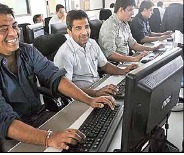
బజాజ్ ఫిన్సెర్వ్ 2.13%, టెక్ మహేంద్రా 1.81%, భారత్ ఎయిర్లైన్ 1.81%, సన్ ఫిన్ 1.77%, అలాబెక్ సిమెంట్ 1.62% పెరిగాయి. యాక్సిస్ బ్యాంక్ 1.56%, ఎన్ఐఐ 1.13%, మహేంద్రా పెరిగి 95.18 వద్ద ముగిసింది. బ్యారెల్ టైంట్ ముడి చమురు ధర 0.14% పెరిగి 71.94 డాలర్ల వద్ద ట్రేడ్ చేయబడింది. ఆసియా మార్కెట్లన్నీ లాభాల్లో ముగియగా.. ఐరోపా మార్కెట్ల సానుకూల ధోరణిలోనే ఆరంభమయ్యాయి. బీఎన్ఈలోని నమోదిత కంపెనీల మార్కెట్ విలువ రూ.39,000 కోట్లు పెరిగి రూ.480.19 లక్షల కోట్ల (5.04 లక్షల కోట్ల డాలర్ల) కు చేరింది. తగ్గిన లాభాలు.. ఉదయం బీఎన్ఈ సెన్సెక్స్ 78,152.34 పాయింట్ల వద్ద లాభాల్లో ఆరంభమైంది. ఆ తర్వాత ఒడుదొడుకుల మధ్య సూచీ కదలాడింది. మధ్యాహ్నం తర్వాత లాభాలు తగ్గుతూ వచ్చినా, చివరకు 261.79 పాయింట్ల లాభంతో 77,763.91 పాయింట్ల వద్ద ముగిసింది. నిఫ్టీ 95.15 పాయింట్లు పెరిగి 24,270.85 పాయింట్ల వద్ద సమీపించింది. ఇంకా డిజిల్ 24,252.35 పాయింట్ల వద్ద కనిష్టస్థాయి: 24,378.15 పాయింట్ల వద్ద గరిష్టస్థాయి నమోదుచేసింది. వారం మొత్తం మిన సెన్సెక్స్ 663 పాయింట్లు, నిఫ్టీ 215 పాయింట్లు పెరిగాయి. సెన్సెక్స్ 30 కంపెనీల షేర్లలో 12 మినహా మిగతావి లాభాల్లో ముగిశాయి. హెచ్ఎన్ఐఐ 5.79%,