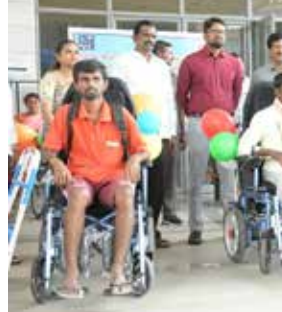
వనపర్తి జూలై 4 (పుడయం ప్రతినది)