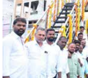
సంగారెడ్డి, జూలై 4: పుడయం.

తెలంగాణ సాయుధ రైతాంగ పోరాట తొలి అమరుడు దొడ్డి కొమరయ్య పరం తిని పురస్కరించుకొని శనివారం జిల్లా వెనుకబడిన తరగతుల సంక్షేమ శాఖ అధ్యక్షుల సంగారెడ్డి పట్టణంలోని పోలి