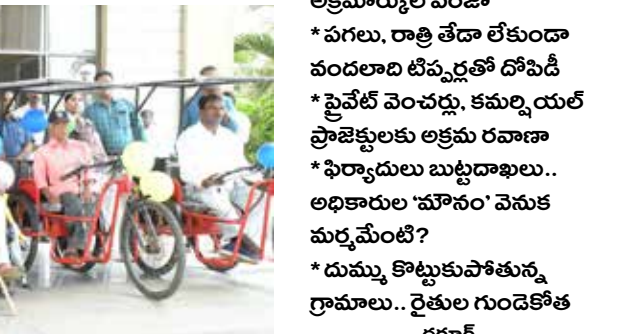
జూలై 04 (పుడయం బ్యూరో)

జోగులాంబ గద్వాల జిల్లాలో 'మట్టి' మహిళా చలారేపిలో. ప్రభుత్వ అన్ని కాపాడాల్సిన రక్షకలలో 'మామూళ్' మత్తులో జోగులాంబలో తో అక్షమార్కులు ఏకంగా గద్వాలనే తప్పిస్తున్నారు. ధర్మార మండలం జాంపల్లి గ్రామ శివారులోని ర్యాలం పాడు రిజర్వాయర్ గ్రామీణీ కాలన పంపుడు ఈ దోపిడీ దారులకు ప్రధాన వనరుగా మారింది. గత వారం రోజులుగా ఇక్కడి ప్రభుత్వ మట్టిని కొల్ల గొడుతు. కొల్ల రూపాయల ప్రజాధనాన్ని అక్షమార్కులు తమ జేబుల్లో నింపుతున్నారు. కాసుల కక్కుర్తి.. యథేచ్ఛగా తరలింపు నియమ నిబంధనలను దాడిలో పోసిన లెక్కలు చేస్తూ, పగలు దాడి అనే తేదా వేసేటం దానికొకటి తప్పకాలు జరుపుతున్నారు. వందలాది టీవీ డార్ల ఈ మట్టిని ధర్మార, జీవీ రెడ్డి మండలాలలో ఏకంగా గద్వాల పట్టణంలోని ప్రైవేట్ వెంపర్లకు, భారీ గుర్తు నిర్మాణాలకు తరలిస్తూ సొమ్ము చేసుకుంటున్నారు. ఇంత బెహిరంగం తో అక్షమార్కులు మైసింగ్, ఇరిగేషన్, రెవెన్యూ శాఖలు కట్ట మాసుకోవడం వెనుక ఉన్న 'సహకారం' ఏంటో అర్థం కాక స్థానికులు ముక్కున వేలే సుకుంటున్నారు. త్యాగాలు రైతులవి..