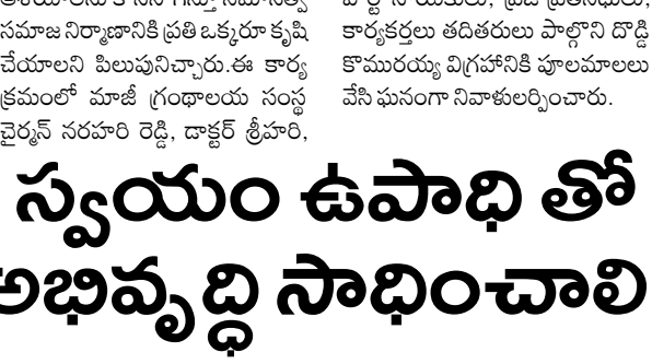
ద్వారా కుటుంబ మిషన్ శిక్షణ కేంద్రాన్ని జిల్లా మైనారిటీ సంక్షేమ అధికారి ప్రారంభించారు. సాంకేతికంగా అభివృద్ధి చెందిన కుటుంబంపై పుణ్యలలో ఇంకా