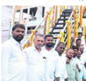
సంగారెడ్డి, జూలై 4: పుడయం.

తెలంగాణ సాయుధ రైతాంగ పోరాట తొలి అమరుడు దొడ్డి కొమరయ్య పరం తిని పురస్కరించుకొని శనివారం జిల్లా వెనుకబడిన తరగతుల సంక్షేమ శాఖ అధ్యక్షుల సంగారెడ్డి పట్టణంలోని పోలి