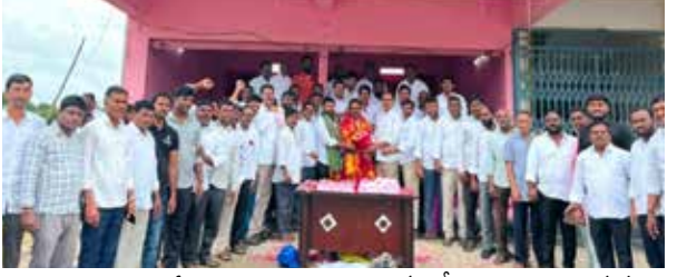
జిన్నారం జైల్ 4 (వృద్ధయం ప్రతినిధి)