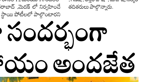
విద్యార్థులు రాష్ట్ర స్థాయిలో పథకాలు సాధించాలి