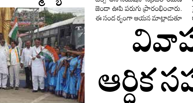
పుడయం న్యూస్ కొండపాక ప్రతినది జూలై 4