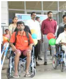
వనపర్తి జూలై 4 (పుడయం ప్రతినది)