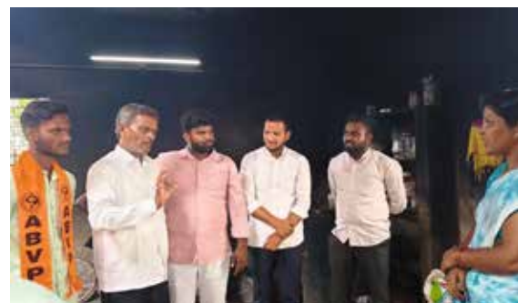
నారాయణపేట జూలై 4 (పుడయం ప్రతినది)

మధ్యాహ్న భోజన పరిశీలన కార్యక్రమంలో భాగంగా నారాయణపేట పట్టణంలోని గ్రౌండ్ స్కూల్ ప్రభుత్వ ఉన్నత పాఠశాలలో అఖిల భారత విద్యార్థి పరిషత్ నాయకులు శనివారం మిడ్ డే ను పరిశీలించారు. దాదాపు 800 మంది విద్యార్థులు ఉన్న పాఠశాలలో సగానికి పైగా మధ్యాహ్న భోజనానికి టిఫిన్ విద్యార్థులు ఇంటి నుండి తీసుకురావడం, అదేవిధంగా ఏ ఒక్క విద్యార్థి కూడా కావాల్సినంత