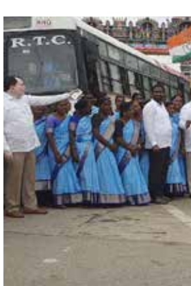
వైద్యం జూలై 4 (పుడయం)