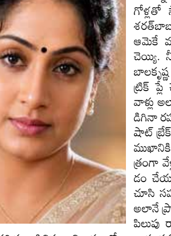
నాట్యాలను ప్రదర్శిస్తూ సినిమా విజయంలో హీరోతో పాటు హీరోయిన్ కి అధిక స్థానం వుండనేమీదే చేసింది. టి.కృష్ణ దృష్టిలో పడటంతో ఆయన దర్శకత్వంలో రూపొందిన నేటి భారతం, వందేమాతరం, దేశంలో దొంగలు పడ్డారు, దేవాలయం, ప్రతిఘటన, రెవెన్యూ పోరులు' చిత్రాలన్ని ఆమెలోని వివిధ పార్శ్వాలును బయటి పెట్టి ప్రభావంతురాలుగా నిరూపించాయి.

అమెరికన్ ప్రతాప్ మాటింగ్ త్రీప్తయ్యలో జరుగుతుందా ఆ చిత్ర సారథి చై. హరి కృష్ణను 'డాడ్' అని పిలిచే అలవాటుతో డాడ్ అని పిలిచింది. 'ఎండుకమ్మాయి' అని ఆయన దగ్గరకు రాగానే ఆయన ముత్యాలతో కనిపించే ఓ సరాన్ని పట్టుకుని లాగి, 'టప్' అనే శబ్దం వచ్చేలా చేసింది. ఆయనకి, ఏమిటమైన నోట్స్ కలగలేదు కానీ ఆ శబ్దం అందరూ చూడూ మూగారు. మరోసారి హరికృష్ణ మీద కృష్ణ అని, తర్వాత శరత్ బాబు చేయి పట్టుకుని అలా చేసింది. "సరాన్ని పట్టుకున్నట్లు రెండు వేళ్లతో పట్టుకుని గోళ్లతో సాండ్ చేయిస్తున్నావు కదా!" అని శరత్ బాబు అడిగితే కాదంటి. యూనిట్ పనులు అమెకే వత్తాను పలికారు. "నా చేతికి అలా చెయ్యి. నీ గుట్టు విప్పతూ, రట్టు చేస్తా" అని బాలకృష్ణ చేయించారు. రెండు సార్లు ఆ ట్రిక్ ప్లే చేసింది. బాలకృష్ణతో బాటు మిగతా వాళ్లు అలా ఆ ప్రయత్నం చేయసాగారు. ఎంత దీనిగా రూపొందినా చెప్పలేదు విజయశాంతి. మరో హిట్ ట్రెక్ లో కర్నీలో కూర్చోని తేతులు రెండు ముఖానికి కొంచెం దూరంలో పెట్టుకుని విచిత్రంగా వేళ్లను కదుపుతూ, తిప్పుతూ మళ్లీ కలపడం చేయసాగారు. ఇంతకీ, ఆమె చేసే పనిని చూసి సహచర నటీనటులు తదితరులు కూడా ఆలానే ప్రాక్టీసు చేయసాగారు. 'హిట్ రెడీ' అని బిల్లుల రాగానే ఆమె వెళ్లి వెళ్లిపోయింది. మిగతా వాళ్లు తమ ప్రాక్టీసు మానేసే లేదు. విజయశాంతి తో మీరు "ఎలా చేస్తారో చెప్పండి" అని అడిగితే కాలక్షేపం కోసం చేసే ట్రిక్ రూపాన్ని చెప్పేస్తే ఎలా?" అని సమస్య వెళ్లిపోయింది.