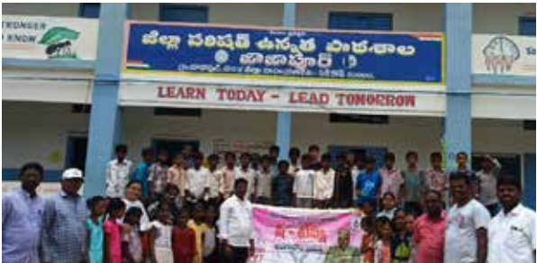
నారాయణపేట జూలై 4 (పుడయం ప్రతినది)