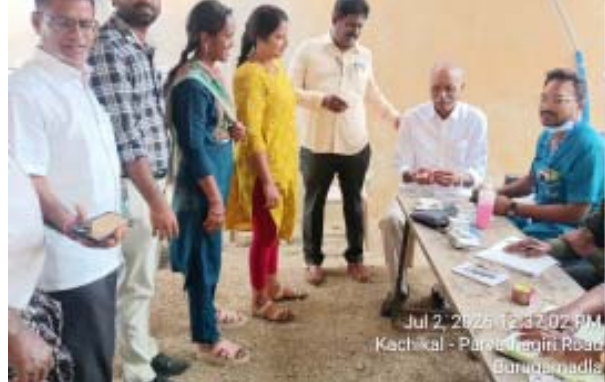
బారుగుమ్మళ్ల గ్రామంలో ఉచిత గుండె పరీక్షలు కోసేటి.