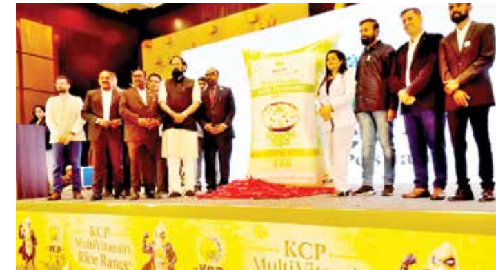
వంటి విలువ ఆధారిత ఉత్పత్తులు ప్రజల ఆరోగ్యానికి మేలు చేయడంలో పాటు అంతర్జాతీయ మార్కెట్లోనూ మంచి అదరణ పొంది అవకాశం ముందని చెప్పారు. "తెలంగాణలో మాత్రమే విశ్రయాపై ఆధారపడకుండా దేశవ్యాప్తంగా, గ్యానికీ మేలు చేయడంలో పాటు అంతర్జాతీయ మార్కెట్లోనూ మంచి అదరణ పొంది అవకాశం ముందని చెప్పారు. "తెలంగాణలో మాత్రమే

వ్యవసాయ సామర్థ్యానికి, రైతుల శ్రమకు, మా ప్రభుత్వ రైతు అనుకూల విధానాలకు నిదర్శనం" అని ఆయన అన్నారు. యాసంగి ధాన్యం కొనుగోలు కోసం రైతుల బ్యాంకు ఖాతాల్లోకి ఇప్పటికే రూ.19,303 కోట్లకు చేరుగా జమ చేసినట్లు వెల్లడించారు. పారదర్శక కత్తో, వేగవంతంగా రైతులకు చెల్లింపులు జరిపిన రాష్ట్రంగా తెలంగాణ నిలిచిందన్నారు. వానాకాలం, యాసంగి సీజన్లను కలిపి చూస్తే రాష్ట్రంలో బియ్యం ఉత్పత్తి 300 లక్షల మెట్రిక్ టన్నులు (300 ఎల్ఎంబీలు) దాటిందని తెలిపారు. రాష్ట్ర ప్రజల వినియోగం సంతృప్తిగా ఏడాది బియ్యం ఉత్పత్తి రాష్ట్రంగా ఎదిగిందని పేర్కొన్నారు. విలువ కోడింపే భవిష్యత్తు.. రైస్ పరిశ్రమ ఆధునిక సాంకేతికతను స్వీకరించాలని మంత్రి విలుపునిచ్చారు. మల్టీ విటమిన్ రైస్