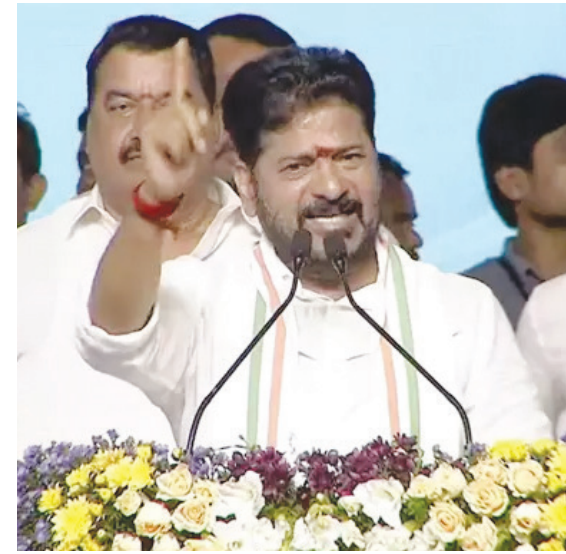
నల్గొండ, జూన్ 28 (పుడయం) :

గుంటూరు 29-06-2026 సోమవారం సంపుటి : 13 | సంచిక : 107 SINCE 25 YEARS CIRCULATED TELUGU DAILY రూ. 3.00 | పేజీలు : 12 VOODAYAM Telugu Daily Simultaneously Published from Guntur, Hyderabad, Adilabad, Karimnagar, Khammam & Warangal Postal Regd. No. GTR/117/2025-27 Follow us on