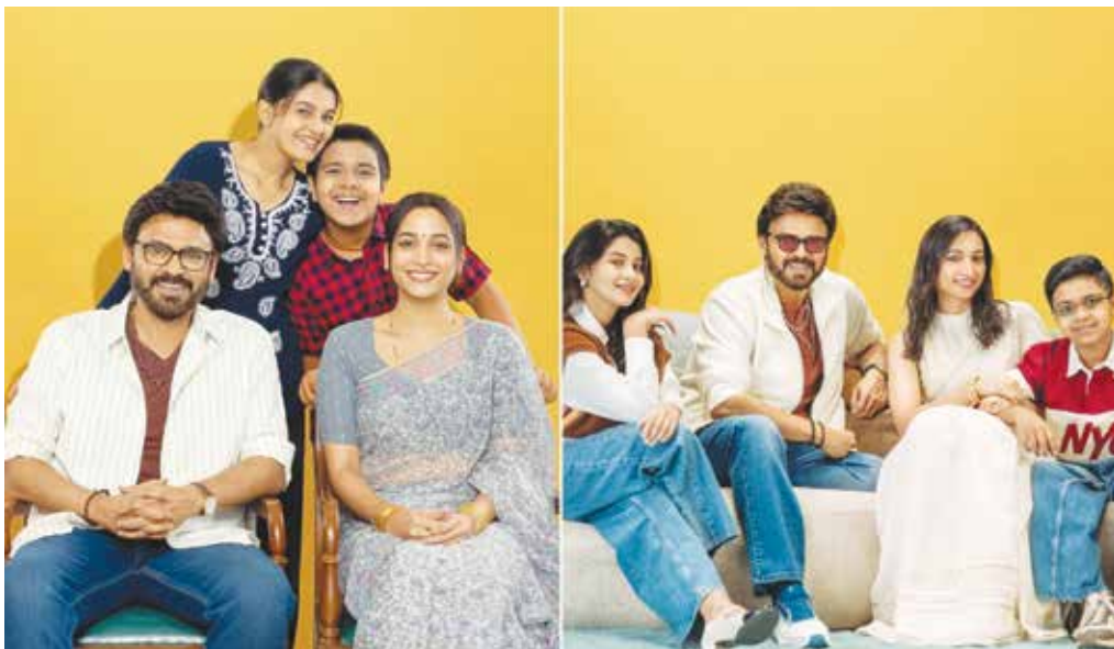
ప్రేక్షకులకు సంపూర్ణమైన సినిమా అనుభూతిని అందించడానికి 'ఆదర్శ కుటుంబం హాస్ నెం: 47' సిద్ధమవుతోంది.