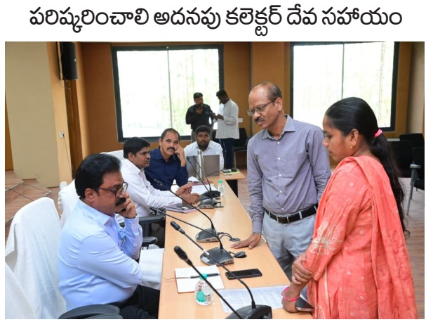
నాగర్ కర్నూల్, జూన్ 08