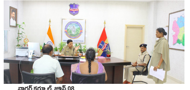
నాగర్ కర్నూల్, జూన్ 08 (పుడయం బ్యారో)