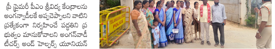
అదనపు కలెక్టర్ కు సిబిఐ యువనీ నారాయణపేట జూన్ 08 (పుడయం ప్రతినిధి)