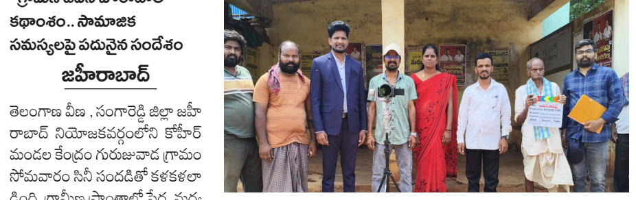
- గ్రామీణ జీవన పోరాటాలే కథాంశం. సామాజిక సమస్యలపై పదునైన సందేశం జ్యోతిరాబాద్