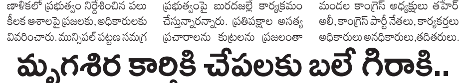
మెదక్ జిల్లా పుడయం ప్రతినిధి