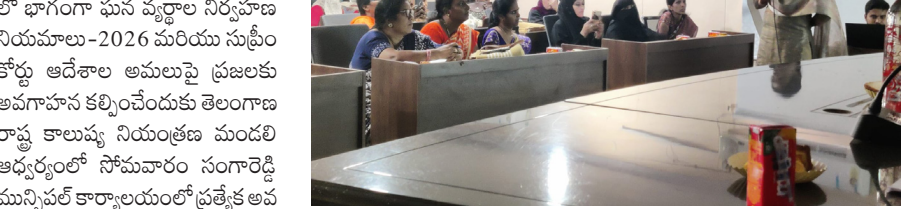
నారాయణపేట జూన్ 8:పుడయం.

ప్రజాపాలన 99 రోజుల కార్యక్రమంలో భాగంగా ఘన వ్యర్థాల నిర్వహణ నియమాలు-2026 మరియు సుప్రీం కోర్టు ఆదేశాల అమలుపై ప్రజలకు అవగాహన కల్పించేందుకు తెలంగాణ రాష్ట్ర కాల్యక్రమ నియంత్రణ మండలి ఆధ్వర్యంలో సోమవారం సంగారెడ్డి మున్సిపల్ కార్యాలయంలో ప్రత్యేక అవగాహన కార్యక్రమం నిర్వహించారు.