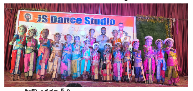
జూన్ 8 వృద్ధుల ప్రతినిధి

జె ఎస్ డాన్స్ అకాడమీ ఆధ్వర్యంలో 30 రోజుల పాటు నిర్వహించిన, విద్యా ర్థుల వేసవి సంగీత, నృత్య శిక్షణ శిబిరం ముగింపు కార్యక్రమాన్ని ఆదివారం రాత్రి అట్లూరులో నిర్వహించారు.