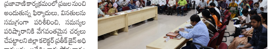
జిల్లా కలెక్టర్ ప్రతీక్ జైన్ సంగారెడ్డి, జూన్ 08: పుడయం.

ప్రజావాణి కార్యక్రమంలో ప్రజల నుంచి అందుతున్న ఫిర్యాదులు, వినతులను సమగ్రంగా పరిశీలించి, సమస్యల పరిష్కారానికి వేగవంతమైన చర్యలు చేపట్టాలని జిల్లా కలెక్టర్ ప్రతీక్ జైన్ అధికారులను ఆదేశించారు. సోమవారం కలెక్టర్ డి.వి.ఎస్ పాటిల్ నిర్వహించిన ప్రజావాణి కార్యక్రమంలో జిల్లా కలెక్టర్ ప్రతీక్ జైన్ ప్రజల నుంచి ఫిర్యాదులు, వినతులను స్వీకరించారు. ఈ సందర్భంగా కలెక్టర్ మాట్లాడుతూ, ప్రజావాణిలో అందిన ప్రజల సంబంధిత అధికారులను సానుకూల దృక్పథంతో స్వీకరించి, క్షేత్రస్థాయిలో పూర్తిస్థాయిలో విచారణ జరిపి, సమస్యల పరిష్కారానికి చర్యలు తీసుకోవాలని సూచించారు.