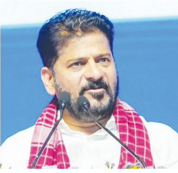
హైదరాబాద్ / ఉప్పల్ జూన్ 7 (ఎంఎస్) : ముఖ్యమంత్రి రేవంత్ రెడ్డి విసురుతున్న నవాజుకు, తాటాకు చప్పుళ్లకు తానేమీ భయపడే ప్రసక్తి లేదని కేంద్రమంత్రి, భాజపా రాష్ట్ర అధ్యక్షుడు జి. కిషన్ రెడ్డి స్పష్టం చేశారు. ఏ అంశం మీద, ఎక్కడ చర్చ పెట్టినా తాను సిద్ధమేనని సీఎం సవాల్ విసిరారు. తెలంగాణ పాలిమేరలోకి రాకుండా తనను ఆపేవారు ఈ రాష్ట్రంలో ఇంకా ఉన్నారేనని ఆయన ధీమా వ్యక్తం చేశారు. సీఎం రేవంత్ రెడ్డి చేసిన ఆరోపణలపై కేంద్రమంత్రి శనివారం ఇక్కడ మీడియాతో మాట్లాడుతూ మాట్లాడుతున్నారని ఆయన పేర్కొన్నారు.

నేను రేవంత్ లా పది పార్టీలు మారలేదు! నేను రేవంత్ రెడ్డిలాగా పది పార్టీలు మారలేదు. నా పట్టుకు, చావు.. రెండూ భారతీయ జనతా పార్టీ లోనే. కిషన్ రెడ్డి అంటే ఏంటో, నా వ్యక్తిత్వం ఏంటో తెలంగాణ ప్రజలందరికీ బాగా తెలుసు. ఎవరు ఎంత రెచ్చగొట్టినా నేను తొందరపడను, నిగ్రహం కోల్పోను. అన్నింటికీ సమయమే సమాధానం చెబుతుంది" అని కిషన్ రెడ్డి వ్యాఖ్యానించారు. హామీలు నెరవేర్చకపోతే దళితులు, బీసీలు దర్జా చేస్తారు ముందు ముఖ్యమంత్రిగా తెలంగాణ ప్రజలకు ఇచ్చిన ఎన్నికల హామీలను నెరవేర్చడంపై రేవంత్ రెడ్డి దృష్టి పెట్టాలని కిషన్ రెడ్డి హితవు పలికారు. ఇచ్చిన మాట నిలబెట్టుకోకపోతే రాజీయే రోజులో దళితులు, బీసీలు పెద్ద ఎత్తున సీఎం ఇంటికి వచ్చి దర్జాలు చేస్తారని హెచ్చరించారు. రాజకీయం లెక్కలేనంత ఇతరులపై బుర్రజడలడం మానేసి, పాలనపై శ్రద్ధ పెట్టాలని డిమాండ్ చేశారు.