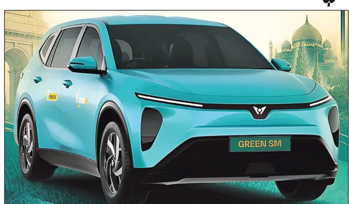
గ్రీన్ ఎన్ఎం ఈ సేవల కోసం గ్రీన్ ఎన్ఎం ఉపయోగించనుంది. దేశవ్యాప్తంగా వారికి సేవలను అభివృద్ధి చేస్తున్న విగ్నీతో భాగస్వామ్య ఒప్పందాన్ని కుదుర్చుకున్నట్లు గ్రీన్ ఎన్ఎం తెలిపింది.