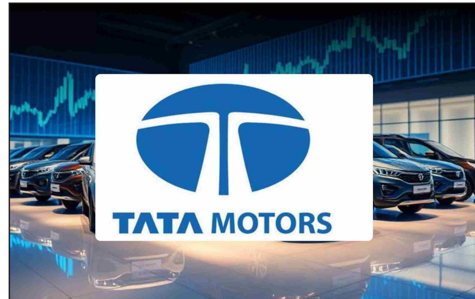
వృద్ధి ద్వారా, పలు మార్కెట్లలో కంపెనీ మరింత బలోపేతం కానుంది. సాంకేతికత, ఆవిష్కరణలో అగ్రస్థానంలో కొనసాగడానికి టాటా మోటార్స్ పరిశోధన- అభివృద్ధిపై పెట్టుబడులు పెట్టునుంది. వాణిజ్య వాహన విభాగాల్లో విద్యుత్ మోడల్స్ తీసుకురావడం, హైటెక్నోలో సీడివీ వాహనాలను సహా భవిష్యత్తరం ఇంజనీర్లు అభివృద్ధి చేయడం, డిజిటలైజేషన్, ఏబి ఆధారిత మార్కులపై దృష్టి పెట్టుతుంది.

ఇటలీ ట్రక్కుల తయారీ సంస్థ 'ఇవెకో'ను కొనుగోలు చేయడం ద్వారా ప్రపంచంలో అగ్రగామి 4 వాణిజ్య వాహన తయారీ సంస్థలో ఒకటిగా టాటా మోటార్స్ నిలవనుందని కంపెనీ చైర్మన్ ఎన్. చంద్రశేఖరన్ తెలిపారు. గోవాలో జరిగిన టాటా మోటార్స్ కమ్యూనిటీ మేజిక్ లో డీలర్ బిజినెస్ ప్లానింగ్ మీట్ 2026లో ఆయన ఈ వివరాలు వెల్లడించారు. 2017లో టాటా గ్రూప్ లాభాదాయం 100 బిలియన్ డాలర్లు (సుమారు రూ. 9.50 లక్షల కోట్లు) అయితే.. ఇప్పుడు గ్రూప్ వాహన విభాగం ఒక్కటే 80 బి. డాలర్ (రూ. 7,60,000 కోట్లు) ఆదాయాన్ని నమోదు చేస్తోందని, ప్రపంచవ్యాప్తంగా షోరీ ఇచ్చేలా కంపెనీ తయారైందని వెల్లడించారు. 'అంతర్జాతీయంగా అత్యంత ప్రభావ వంతమైన వాణిజ్య వాహన సంస్థను నిర్మించనున్నాం. ఇవెకో కొనుగోలు ద్వారా ప్రపంచ అగ్రగామి సంస్థల సరసన టాటా మోటార్స్ నిలుస్తుంది' అని చంద్రశేఖరన్ ధీమా వ్యక్తం చేశారు. ఇవెకో కొనుగోలుకు సంబంధించి, నియంత్రణపరమైన అనుమతులు ప్రక్రియ నడుస్తోందని, ప్రస్తుత ఆర్థిక సంవత్సరం జులై-సెప్టెంబరులో ఈ లావాదేవీ ఫార్మ్యేట్ అవకాశం ఉందన్నారు. దీని వల్ల అధునాతన అంతర్జాతీయ సాంకేతికతలు, విదేశీ మార్కెట్ల టాటాలకు అందుబాటులోకి వస్తాయి. రాబోయే అయిదేళ్ల పాటు బలంగా ఉన్న విభాగాల్లో అగ్రస్థానాన్ని నిలబెట్టుకుంటూనే, కొత్తగా అభివృద్ధి చెందుతున్న విభాగాల్లో అగ్రస్థానాన్ని దక్కించుకోవడంపై టాటా మోటార్స్ దృష్టి పెట్టుతుంది. వచ్చే 3-4 ఏళ్లలో అమ్మకాల