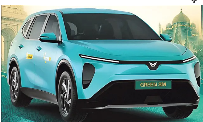
గ్రీన్ఎం ఈ సేవల కోసం గ్రీన్ ఎన్ఎం ఉపయోగించనుంది. దేశవ్యాప్తంగా వారికి సేవలను అభివృద్ధి చేస్తున్న విగ్రీన్తో బాగస్యామ్మ ఒప్పందాన్ని కుదుర్చుకున్నట్లు గ్రీన్ ఎన్ఎంవీ తెలిపింది.

భారత వివజిలో యాప్ డ్యూరా క్యూబ్ సేవలు అందించేందుకు వియత్నాం సంస్థ వన్ గ్రూపునుకు చెందిన వియట్ ల్యాండ్ సేవల సంస్థ గ్రీన్ ఎన్ఎం సిద్ధమైంది. తొలుత దిల్లీ-ఎన్సీఆర్ ప్రాంతంలో కార్చకలా పాలు ప్రారంభించగా, క్రమంగా ఇతర మెట్రో నగరాలకూ సేవలు విస్తరిస్తామని తెలిపింది. ప్రీమియం వినియోగదారులకు లక్షల మంది గ్రీన్ ఎన్ఎం ఇండియా సీఈఓ బాబ్ టువాన్ అన్నీ తెలిపారు. తమ వాహనాల లోపల, బయట సీస్ కిమోలు, ఏబి ఆధారిత పర్మనెంట్ వ్యవస్థలు, డ్రైవర్లు, ప్రయాణికుల కోసం అత్యవసర సహాయ బటన్లు లాంటి పలు భద్రతా ప్రత్యేకతలు ఉన్నాయని తెలిపారు. వినియోగదారులు గ్రీన్ ఎన్ఎం మెంబర్ అప్లికేషన్, ప్రత్యేక హాట్లైన్ డ్యూరా లాదా తమ సేవలు అందు బాటులో ఉన్న ప్రాంతాల్లో నెరుగా రైలు బుక్ చేసుకోవచ్చని కంపెనీ తెలిపింది. ప్రయాణికులకు మెరుగైన సేవల కోసం ప్రత్యేకంగా అభివృద్ధి చేసిన 7 సీట్ విద్యుత్తు ఎన్ఎంవీ విన్ఫాన్