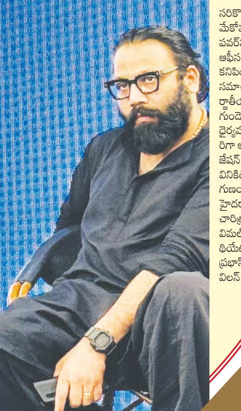
తాజాగా సెట్స్ నుంచి లీకైన ప్రభాస్ సెల్ఫీ ఒకటి సామాజిక మాధ్యమాల్లో పెను సంచలనం సృష్టిస్తోంది. రఫ్ అండ్ రగ్డె లుక్ లో డార్లింగ్ షె