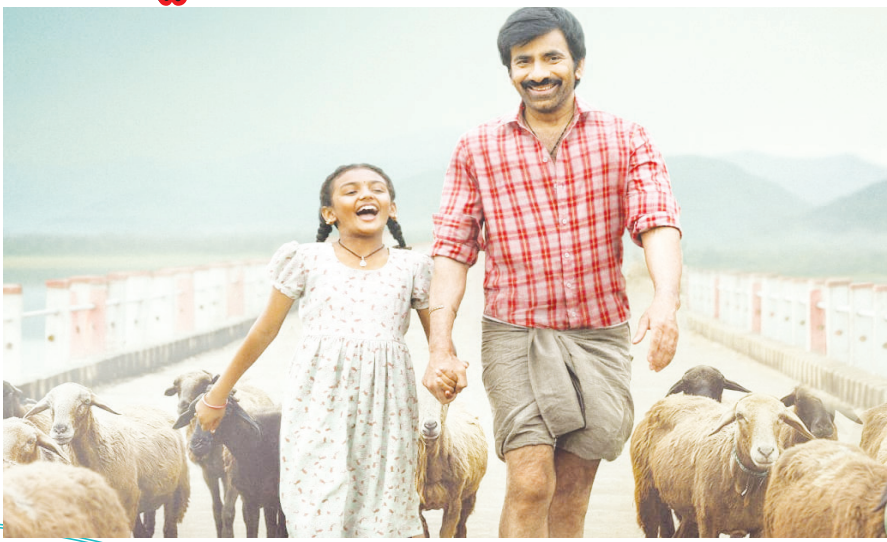
విస్తుంది. చివర్లో కనిపించే ఇరుముడి విజువల్స్ భావోద్వేగాన్ని మరింత పెంచి ప్రేక్షకుల మనసులను తాకాయి. శివ నిర్వాణ మరోసారి తన బలమైన ఎమోషనల్ స్టోరీటిల్లింగ్తో ఆకట్టుకున్నారు. సహజమైన భావోద్వేగాలతో తండ్రి-కూతుళ్ల బంధాన్ని కళ్లకు ప్రధాన బలంగా మలిచారు.

పుదయం సినిమా: మాన్ మహారాజా రవివెంకటేశ 'ఇరుముడి' చిత్రంతో ప్రేక్షకులను ఆశ్చర్యపరచడానికి సిద్ధంగా ఉన్నాడు. శివ నిర్వాణ దర్శకత్వంలో మైతి మూవీ మేకర్స్ నిర్మిస్తున్న 'ఇరుముడి' చిత్రం ఇప్పటికే ప్రేక్షకుల్లో అనకొని రేతెలిస్తోంది. కమర్షియల్ యాక్సన్ కు భావోద్వేగాలను తోడిస్తూ రూపొందుతున్న ఈ చిత్రానికి సంబంధించిన 'ది హార్ట్ ఆఫ్ ఇరుముడి' గ్లింప్స్ను తాజాగా విడుదల చేశారు. ది హార్ట్ ఆఫ్ ఇరుముడి గ్లింప్స్లో ఒక కామన్ మ్యాన్ ప్రపంచాన్ని ఆకట్టుకునేలా చూపించారు. తన కూతురి అతని ప్రపంచం. ఆమె అనందం కోసం తీసుకునే నిర్ణయాల్లో అతని జీవితాన్ని నడిపిస్తాడు. తండ్రి-కూతుళ్ల మధ్య ఉన్న అనుబంధాన్ని ఎంతో సహజంగా, హృదయానికి పొత్తుకునేలా ఈ గ్లింప్స్లో ఆవిష్కరించారు. ఈ గ్లింప్స్లో మరో ప్రత్యేక ఆకర్షణ రవివెంకటేశ పాత్రలో కనిపించే ట్రాన్స్ఫర్మేషన్. అయితే ప్రస్తుత దీక్ష స్వీకరించిన తర్వాత ఆయన పాత్రలో కోటుచేసుకునే మార్పు ఎంతో హృదయాన్ని చూపించారు. అది కేవలం ఒక త్యాగంలా కాకుండా, తన కూతురిపై ప్రేమతో, భక్తితో తీసుకున్న నిర్ణయంగా కనిపిస్తుంది.