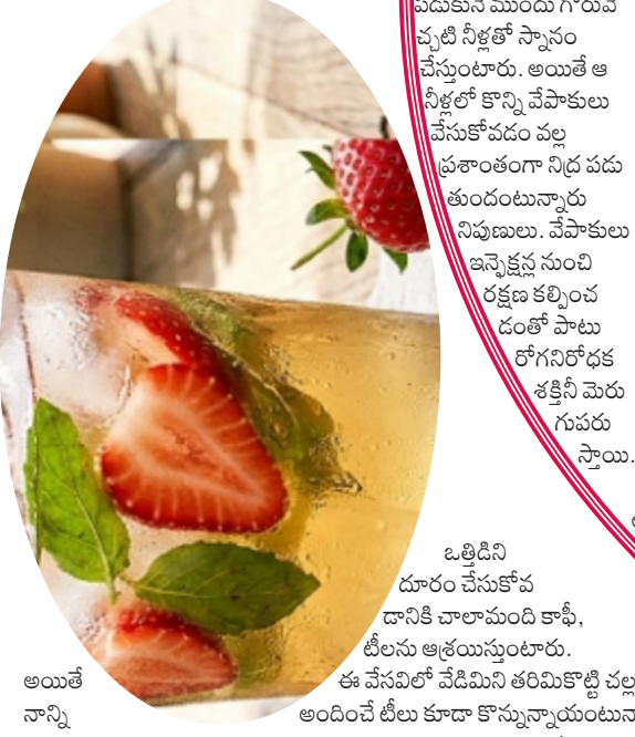
అయితే నాన్ని బట్టిన దూరం చేసుకోవడం దానికి చాలామంది కాఫీ, టీలను ఆశ్రయిస్తుంటారు. ఈ వేసవిలో వేడిమిని తరిమివేయి వల్ల అందించేటటువంటి నిపుణులు. ముందుగా మరిగించి పెట్టుకున్న గ్రీన్ టీ మిశ్రమంలో స్ట్రాబెర్రీ ముక్కలు, తులసి ఆకులు చేసుకోవాలి.

కోవడం తెలిసిందే. అయితే వాటి కన్నా, గ్రీన్ టీని బనము కృత్వా చేసుకొని వాటితో త్వరగా ఫలితం ఉంటుంది అంటున్నారు నిపుణులు. సులభం బాధపడకుండా ఉండండి. కొన్నిసార్లు నెలసరి సమయంలో కూడా ఇలా అనిపించడం సహజం. అయితే కొన్ని జాగ్రత్తలు పాటించడం ద్వారా ఈ సమస్యనుంచి ఉపశమనం పొందవచ్చంటున్నారు నిపుణులు. తక్కువ ఆహారం ఎక్కువసార్లు తినడం వల్ల కడుపు భారం రాకుండా జాగ్రత్తపడవచ్చంటున్నారు నిపుణులు. శరీరంలో సోడియం స్థాయిలు పెరిగినా, డిప్రెషన్ కి గురైనా, టీ-కాఫీలు ఎక్కువగా తాగినా కడుపుభారం బారిన పడే అవకాశాలుకలుచు.