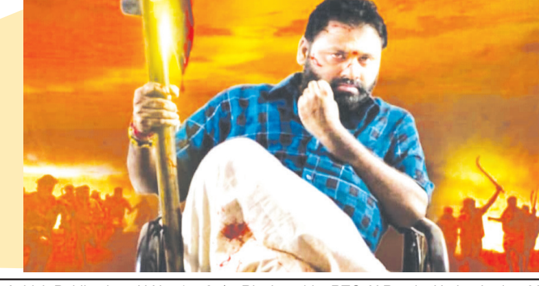
బోతున్న CSSB2 కూడా ప్రతి ప్రేక్షకుడి హృదయాన్ని తాకిలా ఉంటుంది. ప్రతి తండ్రి తన కుమారుడిని ఎలా తీర్చి