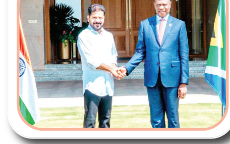
హైదరాబాద్, జూన్ 3 (పుణ్యం ప్రతినది) : తెలంగాణను పెట్టుబడులకు అత్యంత ఆకర్షణ గల స్థానంగా అభివృద్ధి చేస్తున్నామని ముఖ్యమంత్రి రేవంత్ రెడ్డి తెలిపారు. విదేశీ పెట్టుబడులను ఆకర్షించేందుకు తెలంగాణ ప్రభుత్వం ప్రత్యేక చర్యలు తీసుకుంటోందని పేర్కొన్నారు. బుధవారం నాడు ముఖ్యమంత్రి రేవంత్ రెడ్డిని దక్షిణాఫ్రికా ఉపాధ్యక్షుడు పాలస్ మషటైల్ బృందం ఎంసీహెచ్ఆర్డీలో కలిశారు. మిగతా 2లో

తెలంగాణలో పెట్టుబడులు పెట్టేందుకు ఆసక్తి చూపుతున్న దక్షిణాఫ్రికా పారిశ్రామికవేత్తలకు రాష్ట్ర ప్రభుత్వం అన్ని విధాలుగా సహకారం అందించేందుకు సిద్ధంగా ఉంది. పెట్టుబడిదారులకు అనుకూలమైన విధానాలు, పారదర్శక పాలస్, వేగవంతమైన అనుమతుల వ్యవస్థ తెలంగాణ ప్రత్యేకతలు. దక్షిణాఫ్రికా కంపెనీలు తెలంగాణలో పరిశ్రమలు స్థాపించడం ద్వారా ఇరు ప్రాంతాల ఆర్థికాభివృద్ధికి కొత్త అవకాశాలు ఏర్పడతాయి. - సిఎం రేవంత్ రెడ్డి