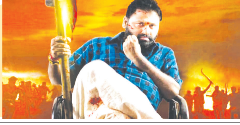
బోతున్న CSSB2 కూడా ప్రతి ప్రేక్షకుడి హృదయాన్ని తాకిలా ఉంటుంది. ప్రతి తండ్రి తన కుమారుడిని ఎలా తీర్చి