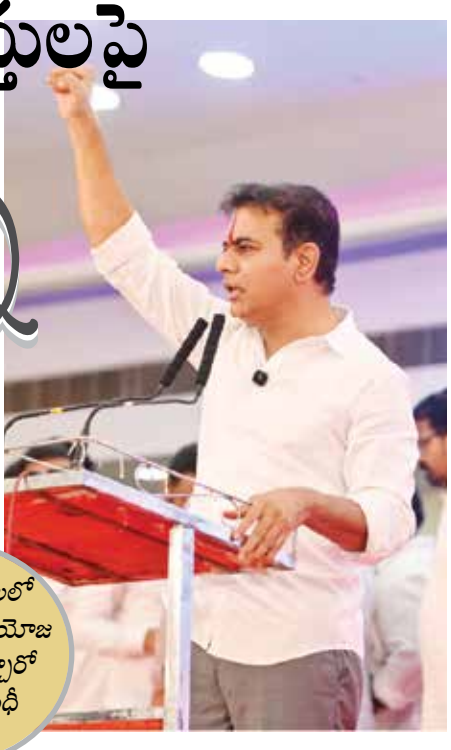
2 సంవత్సరాలలో ఎన్ని డబ్బులు నియోజకవర్గానికి తెచ్చాలో ఎమ్మెల్యే గాంధీ చెప్పాలి

30 వేల కోట్ల రూపాయల ఆస్తులను తన కుటుంబ సభ్యులకు, అన్నదమ్ములకు, అనుచరులకు అప్పజెప్పి భారీ కుంభకోణం అందుకే మెట్రో రైల్ ఎల్ అండ్ టి అధికారులను బ్లాక్ మెయిల్ చేసిన వారిని రాష్ట్రం నుంచి తన్ను తరిమేశారు అందుకే 14,000 కోట్ల రూపాయల ఎల్ అండ్ టి అప్పును రాష్ట్ర ప్రజలపై రుద్దుతున్న ముఖ్యమంత్రి రేవంత్ రెడ్డి హైదరాబాద్ మెట్రో పట్ల చిత్తుతుద్ది ఉంటే గత ప్రభుత్వం ప్రతిపాదించిన మెట్రో విస్తరణకు జీజీపీ ఎందుకు ఆమోదం తెలుపలేదు? రేవంత్ రెడ్డి, కిషన్ రెడ్డి కలిసి ప్రజల దృష్టి ఆకర్షించే విఫల ప్రయత్నం శేరిలింగంపల్లి బీఆర్ఎస్ పార్టీ శ్రేణుల సమావేశంలో కేటీఆర్