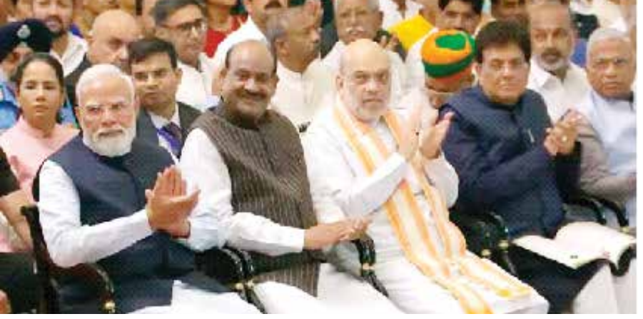
ఢిల్లీలోని రాష్ట్రపతి భవన్ లో పద్మ అవార్డుల రెండో విడత ప్రధానోత్సవానికి హాజరైన ప్రధాని, లోక్ సభ స్పీకర్, హోంమంత్రి తదితరులు