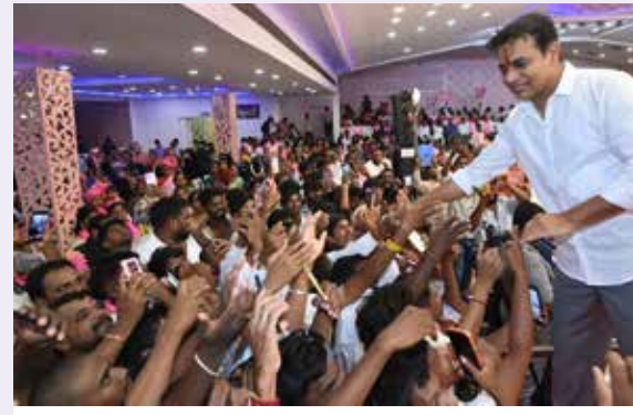
30వేల కోట్ల మెట్రో రైల్ అస్తులపైన రేవంట్ కన్ను

పక్కన, జాతీయ రహదారి పక్కన ఇల్లు కట్టుకుంటే మీ కళ్ళు ఓర్వడం లేదా..? ఈ స్థలం విలువెది కాబట్టి గరిభోళ్ల దగ్గర లాకుంటున్నారా..? వాళ్లకు ఇంక విలువైన స్థలాలు అవసరమా అనుకుంటున్నారా. అనూరు కేసీఆర్ ఇచ్చారు. వాళ్ళ అడ్డంకులు బాగుంది భూముల దరలు పెరిగాయి. కేసీఆర్ ఇచ్చిన పాట్లకు పేదలను ఓసర్లు చేయండి. అంతేగానీ ఆ పాట్లు గుంజుంటామంటే ఊరు కోపోము. ఆలోచన విరమించుకోవాలి.. లెదంటే మరో వెలుగుమట్ల పునరావృతం చేస్తామని ప్రభుత్వం హెచ్చరిస్తున్నామని హాకీరావు అన్నారు.