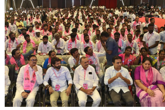
కొత్తూరి కాపాడాలి ప్రతి తప్పనిసరిగా ఏనుమేరేషన్ ఫారం నింపి ఓటుల హక్కులను కాపాడాలి

ను కాపాడుకోవాలని పిలుపునిచ్చారు. ప్రతి బాత్ స్థాయి కార్యకర్త, బాత్ లెవల్ ఏజెంట్ తమ పరిధిలోని ఓటుల వివరాలను క్షుణ్ణంగా పరిశీలించి