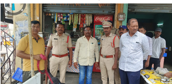
హసన్పల్లి, జూన్ 22 (పుడయం ప్రతినది):

తెలంగాణకు డ్రగ్స్ రహిత రాష్ట్రంగా మార్చేందుకు ప్రభుత్వం మరియూ పోలీస్ శాఖ తీసుకుంటున్న చర్యల్లో భాగంగా పోలీస్ కమిషనరీ పరిధిలో సీబీ ష్రీరీ సీనియర్ ఆఫీసర్లు సహాయంతో క్షుణ్ణంగా పరిశీలించారు. ప్రజా సహకారం అవసరమని సీబి అన్నారు. మీ ప్రాంతంలో ఎవరైనా డ్రగ్స్, గంజాయి లేదా ఇతర మత్తు పదార్థాలను విక్రయించినా, రహజా చేసినా వెంటనే పోలీసులకు సమాచారం అందించాలని సీబి కోరారు. సమాచారం అందించిన వారి వివరాలు అత్యంత గోప్యంగా ఉంచబడతాయని అన్నారు. మత్తు పదార్థాల నిర్మూలనకు ప్రతి ఒక్కరూ బాధ్యతగా వ్యవహరించాలని, చట్ట విరుద్ధమైన కార్యకలాపాలకు పాల్పడితే చట్టపరంగా కఠినమైన శిక్షలు తప్పవని పోలీసులు స్పష్టం చేశారు. ఈ కార్యక్రమంలో పాఠశాల ప్రధానోపాధ్యాయులు, పాఠశాల అధికారులు, డాక్టర్లు, పోలీస్ సిబ్బంది, విద్యార్థులు పాల్గొన్నారు.