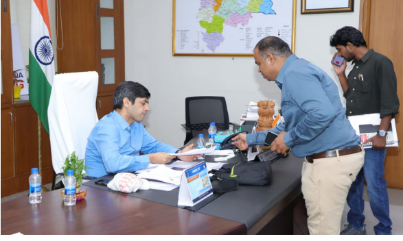
యాదాద్రి భువనగిరి జిల్లా, 22.06, పుడయం: