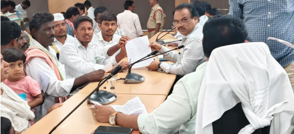
సూర్యాపేట జూన్ 22, పుడయం ప్రతినది: