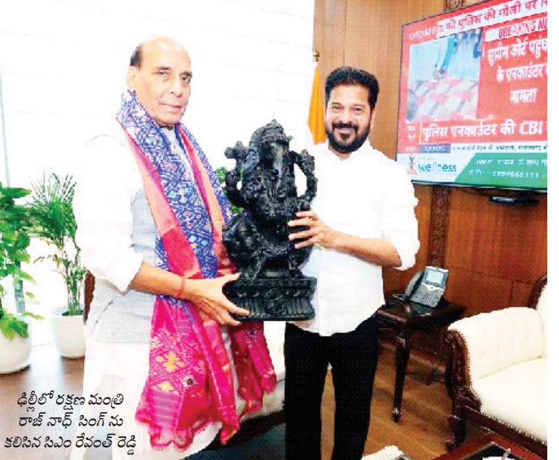
ఢిల్లీలో రక్షణ మంత్రి రాజీనాథ్ సింగ్కు కలిపిన సీఎం రేవంత్ రెడ్డి

ఢిల్లీ పర్యటనలో భాగంగా రైల్వే మంత్రి అశ్వినీ వైష్ణవ్ తో సీఎం భేటీ అయ్యారు. కేంద్రమంత్రి కిషన్ రెడ్డితో కలిసి రైల్వే మంత్రితో రైల్ భవన్లో ఆయన సమావేశమయ్యారు. హైదరాబాద్ మెట్రో రైలు ఫేజ్-2 అనుమతులపై వారు చర్చించారు. హైదరాబాద్ మెట్రో రైలుకు ఐఆర్ఎఫ్సీ రుణం త్వరగా వచ్చేలా చూడాలని కోరారు. రైల్వే మంత్రితో భేటీ ఏర్పాటు చేయించాలని కోరారు.