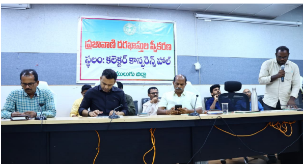
ములుగు, జూన్ 22 (పుడయం ప్రతినది):