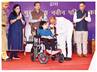
మంత్రి బండే సంజయ్ కుమార్

దేశ ఆర్థిక వ్యవస్థకు కీలకమైన సంస్థలపై దాడి శత్రువుల ప్రధాన లక్ష్యం ఎలాంటి పరిస్థితినినా ఎదుర్కొనేందుకు సిద్ధం కండి ఆధునిక సాంకేతికతను సమకూర్చుకోండి కేంద్ర హోంశాఖ సహాయం మంత్రి బండే సంజయ్ కుమార్