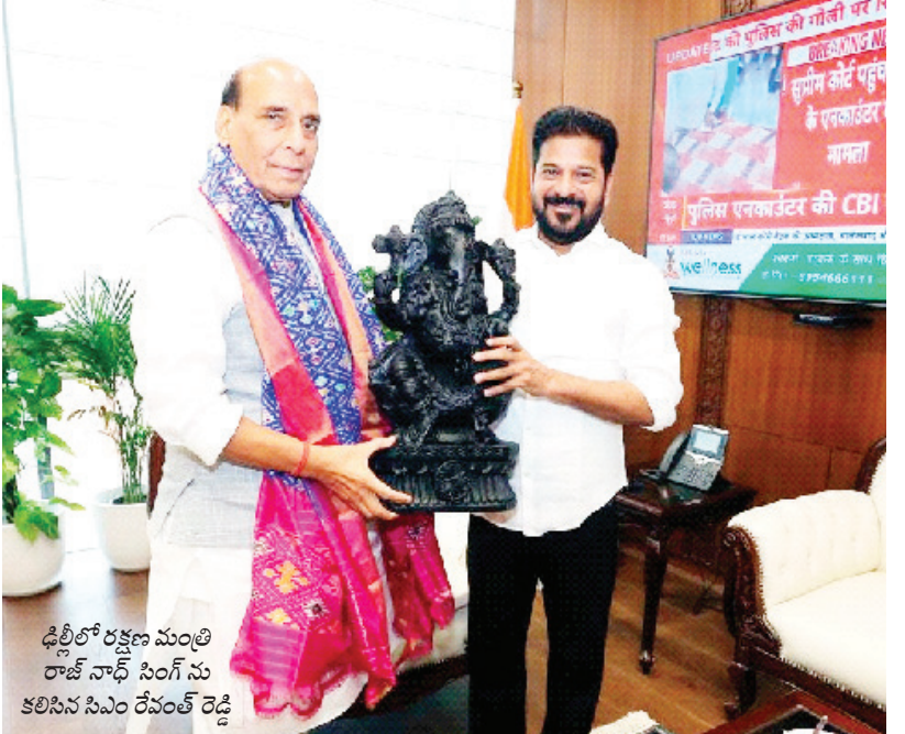
ఢిల్లీలో రక్షణ మంత్రి రాజీనాథ్ సింగ్ కు కలిపిన సీఎం రేవంత్ రెడ్డి

న్యూఢిల్లీ, జూన్ 22 (పుడయం బ్యూరో) : భారత వాయు సేన ఆధ్వర్యంలో నిర్వహించిన ఆదిలాబాద్ ఎయిర్పోర్టును అన్ని వసతులతో అభివృద్ధి చేయాలని రక్షణ శాఖ మంత్రి రాజీనాథ్ సింగ్కు ముఖ్యమంత్రి రేవంత్ రెడ్డి విజ్ఞప్తి చేశారు. ఢిల్లీలోని రక్షణ శాఖ కార్యాలయం కరవ్య భవన్లో రక్షణ శాఖ మంత్రి రాజీనాథ్ సింగ్ తో ముఖ్యమంత్రి రేవంత్ రెడ్డి సోమవారం భేటీ అయ్యారు. ఈ సందర్భంగా గాంధీ సరోవర్ ప్రాజెక్టుకు రక్షణ శాఖ భూములు బదలాయించినందుకు కేంద్ర మంత్రి రాజీనాథ్ సింగ్కు ముఖ్యమంత్రి రేవంత్ రెడ్డి కృతజ్ఞతలు తెలిపారు. రాష్ట్ర ప్రభుత్వ అత్యంత ప్రాధాన్య ప్రాజెక్టుల్లో ఒకటైన ఆదిలాబాద్ ఎయిర్పోర్టు అభివృద్ధికి సంబంధించి భూ సేకరణ, యుటిలిటీస్ బదలాయించు అంశాల్లో ఛార్జిగా సహకారం ప్రాధాన్యతను కేంద్ర మంత్రికి సీఎం తెలియజేశారు.