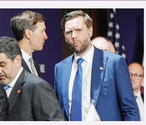
వాన్స్ ఎదురుచూస్తుండగానే ఇరాన్ విదేశాంగమంత్రి వాకాల్ అమెరికా, ఇరాన్ చర్చల్లో పట్టించుకోని ఖతార్ ప్రధాని నివ్వరపోయిన పాక్ నేతలు, ఖతార్ నుంచి వాన్స్ కు అవమానం

వాన్స్ ఎదురుచూస్తుండగానే ఇరాన్ విదేశాంగమంత్రి వాకాల్ అమెరికా, ఇరాన్ చర్చల్లో పట్టించుకోని ఖతార్ ప్రధాని నివ్వరపోయిన పాక్ నేతలు, ఖతార్ నుంచి వాన్స్ కు అవమానం స్వట్జర్లాండ్, జూన్ 22 : పశ్చిమాసియాలో శాశ్వత శాంతిసాధన ప్రయత్నాల్లో భాగంగా అమెరికా, ఇరాన్ ప్రతినిధులు ఆదివారం స్వట్జర్లాండ్ లో భేటీ అయ్యారు. ఆ కీలక సమావేశంలో అమెరికా ఉపాధ్యక్షుడు జేడీవాన్స్ కు అవమానం జరిగినట్లుగా కొన్ని వీడియోలు వైరల్ అవుతున్నాయి. వాన్స్ ఎదురుచూస్తుండగానే ఇరాన్ విదేశాంగ మంత్రి వాకాల్ చేయడం, ఖతార్ ప్రధాని పట్టించుకోవడం వంటివి ఆ వీడియోల్లో కనిపించాయి. చర్యల ప్రారంభం కావడానికి ముందు ఇరాన్ ప్రతినిధులతో కరచాలనం, ఖతార్ సెషన్ నిర్వహించాలని యూఎన్ ప్రతినిధులు