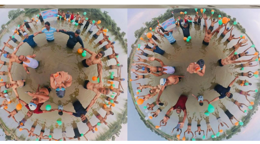
స్విమ్మర్స్ ఆధ్వర్యంలో ఘనంగా యోగా దినోత్సవ వేడుకలు