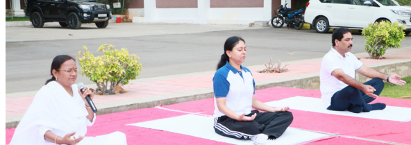
యోగా దినోత్సవాన్ని పురస్కరించుకొని సిద్దిపేట పోలీస్ కమిషనరీలో కార్యాలయంలో ప్రత్యేక యోగా శిక్షణ కార్యక్రమాన్ని ఘనంగా నిర్వహించారు.