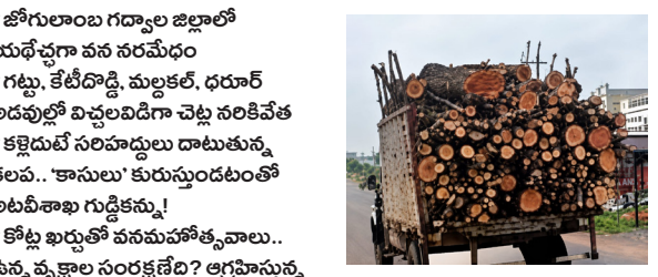
* జోగులాంబ గద్వాల జిల్లాలో యథేచ్ఛా వన సంరక్షణ

* గట్టు, కేటికొడ్డి, మల్లకర్తి, ధర్వారీ అడవుల్లో నివలించిపోతూ వెళ్తున్న కలవం, కానులు కురుస్తుండటంతో అటవీశాఖ గుడ్డికమ్మ! * కోట్ల ఖర్చుతో వన సంరక్షణ... ఉన్నప్పటికీ వన సంరక్షణలో ఆగ్రహాస్తున్న పర్యావరణవేత్తలు గద్వాల జూన్ 21 (వృద్ధయం బ్యూరో) పచ్చని అడవిని కలవం ముఠా దళిబ్బిస్తోంది. పర్యావరణానికి పట్టుగొమ్మలై నిలవాలన్న మహాస్వామి అక్రమార్కుల గొడ్డలి దెబ్బలకు కుప్పకూలుతున్నాయి. సంరక్షించాలన్న అటవీశాఖ అధికారుల 'నిమిషం సరికెళ్లిన' వైఖరి, సరిహద్దుల్లోని కొన్ని శక్తుల లోపాలు కారణమే అడవికి కాపాడం మారాయి. జోగులాంబ గద్వాల జిల్లాలోని గట్టు, కేటికొడ్డి, మల్లకర్తి, ధర్వారీ మండలాల అటవీ ప్రాంతం ప్రస్తుతం కలవం దొంగల పాలిట అక్కయపాత్రగా మారింది. రాత్రింబవళ్ల తేడా లేకుండా