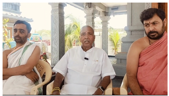
వృద్ధయం స్టూన్స్ జూన్ 21 శివపీఠం...