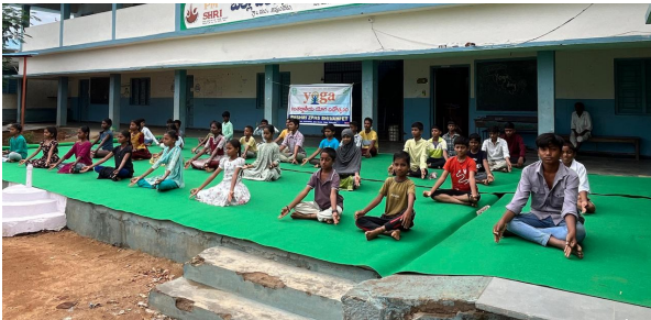
వృద్ధయం స్టూన్స్ శివపీఠం జూన్ 21..

మాయాలను ప్రత్యక్షంగా చేసి చూపిస్తూ నేర్పించారు. నిత్యజీవితంలో యోగ, సూర్య సమస్థానం చేయడం వల్ల ముఖ్య అభిరుచులు, మహాబాబ్ నగర్ లో ఆదివారం మహాబాబ్ నగర్ లో పాలకొండ బైపాస్ రోడ్, శివాజీ విగ్రహం దగ్గర నూతనంగా ఏర్పాటు చేసిన HP షెల్లో బంక్ "శక్తి ప్యూయర్టీ" గారెడ్ ఓపెనింగ్ కార్యక్రమం అత్యంత వైభవంగా జరిగింది. ఈ శుభ సందర్భాన్ని పురస్కరించుకొని ఏర్పాటు చేసిన ప్రారంభోత్సవ కార్యక్రమానికి