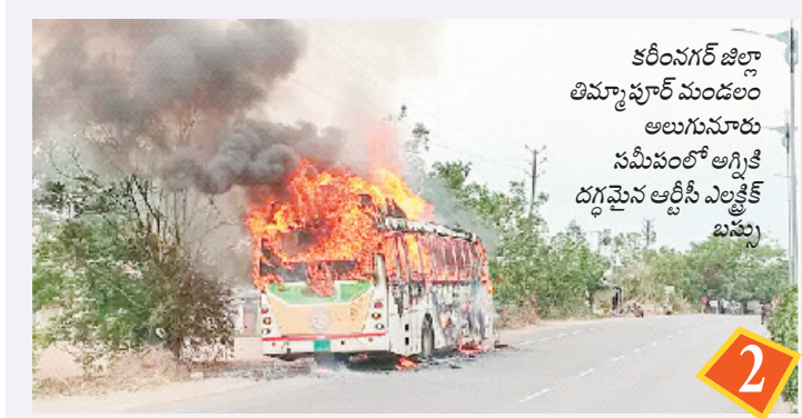
కరీంనగర్ జిల్లా తిమ్మనూరు మండలం అలుగునూరు సమీపంలో అగ్నికే దగ్ధమైన ఆర్టీసీ ఎలక్ట్రిక్ బస్సు

ఆదిలాబాద్ 22-06-2026 సోమవారం సంపుటి : 13 | సంచిక : 232 SINCE 25 YEARS CIRCULATED TELUGU DAILY చూ. 3.00 | పేజీలు : 12 WOODAYAM Telugu DAILY Simultaneously published from Adilabad, Hyderabad, Khammam, Karimnagar, Guntur & Warangal Follow us on