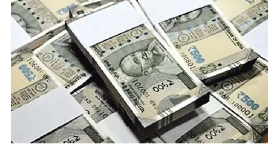
బ్యాంకులు, కార్పొరేట్ సంస్థలు అధికారికంగా ఉంచిన నిధులు కావడంతో.. ఇవి రాజకీయాంగా ఎంతో చర్చనీయాంశంగా ఉన్న నల్లదనం మొత్తాన్ని సూచించడంతో, ఎన్ఆర్ఐలు, ఇతర భారతీయులు, ధర్మ కంట్రీ ఎంటిటీస్ షేర్లలో స్వీస్ బ్యాంకుల్లో దాచిన నిధులు ఈ లెక్కల్లోకి రావు.

స్వీస్ బ్యాంకుల్లో భారతీయుల సొమ్ములు 2025లో 8% తగ్గి 3.25 బిలియన్ స్వీస్ ఫ్రాంకుల (దాదాపు రూ. 36,793 కోట్లు) కు చేరాయి. స్థానిక శాఖలు, ఇతర ఆర్థిక సంస్థల దగ్గర భారతీయులు ఉంచిన నిధులు తగ్గినట్లు స్వీట్జర్లాండ్ సెంట్రల్ బ్యాంక్ గురువారం తెలిపింది. 2024లో స్వీస్ బ్యాంకుల్లో భారతీయుల నిధులు, 2023 కంటే 3 రెట్లు పెరిగి 3.5 బిలియన్ స్వీస్ ఫ్రాంకులకు ఉన్నాయి. 2021లో ఈ నిధులు గరిష్ఠంగా 3.83 బిలియన్ స్వీస్ ఫ్రాంకులకు నమోదయ్యాయి. వ్యక్తిగత, సంస్థాగత క్రయంలో ఖాతా డిమాండ్లు మాత్రం 50% పెరిగి 524 బిలియన్ స్వీస్ ఫ్రాంకుల (దాదాపు రూ. 6,000 కోట్లు) కు చేరాయి. మొత్తం నిధుల్లో ఇవి 16 శాతానికి సమానం. ఇతర బ్యాంకుల ద్వారా ఉన్న నిధుల విలువ 15% తగ్గి 2.6 బిలియన్ స్వీస్ ఫ్రాంకులకు నమోదైంది. బాండ్లు, సెక్యూరిటీల నిధులు 135 మి.స్వీస్ ఫ్రాంకుల నుంచి 105 మి.స్వీస్ ఫ్రాంకులకు తగ్గాయి. ట్రస్టు/ఫిడ్యూషియరీల నిధులు 41 మి.స్వీస్ ఫ్రాంకుల నుంచి 55% తగ్గి 18.6 మి.స్వీస్ ఫ్రాంకులకు పరిమితమయ్యాయి. ఇది నిల్వదనం కాదు; స్వీస్ బ్యాంకుల్లో భారతీయులు, భారతీయ