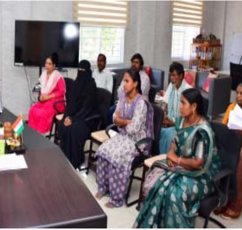
జగిత్యాల జూన్ 01 (వుదయం ప్రతినిధి) ప్రతి సోమవారం ప్రజల సౌకర్యార్థం నిర్వహించే గ్రీవెన్స్ డేలో భాగంగా తేదీ 1 6 2026 సోమవారం జిల్లా పోలీస్ కార్యాలయంలో జిల్లా సుపరేండెంట్ అఫ్ పోలీస్ అశోక్ కుమార్ వల ఫిర్యాదులను పరిశీలించారు జిల్లాలోని వివిధ ప్రాంతాల నుండి వచ్చిన 16 మంది అధికారులతో నేరుగా మాట్లాడి వారి సమస్యలను తెలుసుకున్నారు ప్రతి ఫిర్యాదుపై న్యాయపరంగా పారదర్శకంగా విచారణ జరిపి బాధితులకు త్వరితగతిన న్యాయం అందేలా చర్యలు తీసుకోవాలని అధికారులను ఆదేశించారు చట్ట పరిధిలోకి వచ్చే సమస్యలను అలస్యం చేయకుండా పరిష్కరించాలని విచారణలో ఎటువంటి లోపం ఉండకూడదని సూచించారు ప్రజలకు పోలీస్ శాఖను మరింత చేరువ చేయడం లక్ష్యంగా ప్రజా సమస్యలను వేగంగా పరిష్కరించేందుకు కృషి చేస్తున్నామని తెలిపారు పోలీస్ స్టేషన్ కు వచ్చే ఫిర్యాదులతో మార్గాదర్శక మాట్లాడి వినతులను స్వీకరించి క్షేత్ర స్థాయిలో పరిశీలించి వేగంగా స్పందించడం జరుగుతుందన్నారు