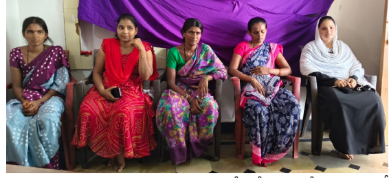
గడ్డాలు జూన్ 17 (పుడయం బ్యూరో)

జోగులూరి గడ్డాలు జిల్లా గట్టు మండలం అధ్యక్షుడు సంఘం ఆవేదన తెలంగాణ విద్యా వ్యవస్థ నేడు ఒక చారిత్రక సంక్షోభ సంద్విగ్ధంగా లో నిలిచింది. రాష్ట్ర భవిష్యత్తును, సామాజిక న్యాయాన్ని నిర్మించాల్సిన ప్రభుత్వ విద్యార్థులను బలోపేతం చేయాలింది. వీరూ, వికంగా పాఠశాలల సంఖ్యను భారీగా తగ్గించే అలవాటు రావడం తీవ్ర ఆందోళన కలం. సుమారు 27 వేల ప్రభుత్వ పాఠశాలలను కేవలం 4 వేలకే తగ్గించడం చేయాలనే ప్రతిపాదనలు నిజమైతే, అది అజాగ్రహణ అక్షరాస్యతను గొప్పపెట్టే అవుతుంది. ప్రజాకాంక్షకు బిచ్చంగా ప్రభుత్వ అధికారులకే కా నేటికా తల్లుల సంఘాలు, ఉపాధ్యాయులు, గ్రామసంచారులు తీవ్ర ప్రతి