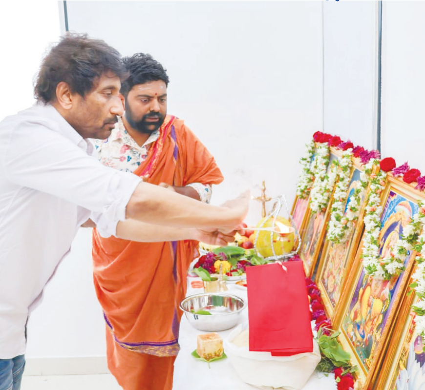
తెరకెక్కును సూతన చిత్రానికి సంబంధించిన ఆఫీస్ ప్రారంభోత్సవ పూజా