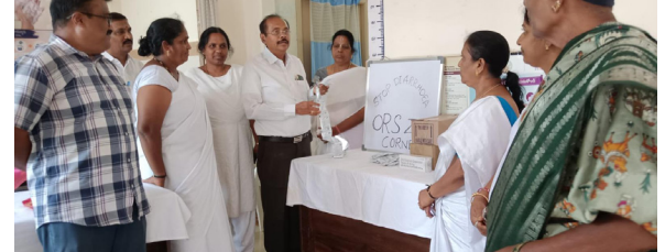
మామిడి నగర్ జూన్ 17 (పుడయం ప్రతినిధి)