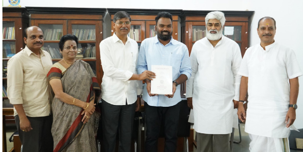
నాగర్ కర్నూల్, జూన్ 17 (పుడయం ప్రతినిధి)