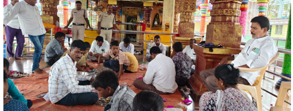
ఆందూర్ పుడయం జూన్ 17 - మండలంలోని కొత్తాపూర్ రేణుకా ఎల్లమ్మ ఆలయ హుండ్లీని గురు వారం లెక్కింపు. - - - - -