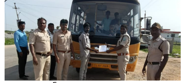
అయిజ జూన్ 17 (పుడయం కరనాంబెంట్)

విద్యార్థుల భద్రతను గాలికొదిలి ఫిట్నెస్ సర్టిఫికేట్లు లేకుండానే స్కూల్ బస్సులను నడుపుతున్న పాఠశాలలపై రవాణాశాఖ అధికారులు ఉక్కుపాదం మోపారు. అయిజ పట్టణంలో బుధవారం నిర్వహించిన అసెస్మెంట్ తనిఖీ చేసిన అధికారులు, వాటికి చల్లబాటు అయ్యే ఫిట్నెస్ సర్టిఫికేట్లు లేవని గుర్తించారు. విద్యార్థులకు తరలిం చేసే వాహనాల్లో భద్రతా ప్రమాణాలు తప్ప