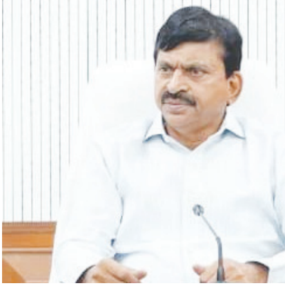
కొనసాగడం సరైనది కాదు. ప్రజలకు సేవందించే కేంద్రాలు గౌరవప్రదంగా ఉండాలనే గౌరవ ముఖ్యమంత్రి రేవంత్ రెడ్డి గారి ఆలోచనకు అనుగుణంగా ఈ నిర్ణయం తీసుకున్నామని మంత్రి స్పష్టం చేశారు. మొదటి దశలో అద్దె భవనాల్లో, శిథిలావస్థలో ఉన్న 125 తహసీల్దార్ కార్యాలయాలు, 11 ఆర్టివో కార్యాలయాలకు ఆధునిక సౌకర్యాలతో శాశ్వత భవనాలు నిర్మిస్తామని వెల్లడించారు. అలాగే అవసరమైన చోట్ల మరమ్మత్తులు చేపట్టడానికి నివేదికలు అందించాలని రెవెన్యూ సెక్రటరీని ఆదేశించారు.