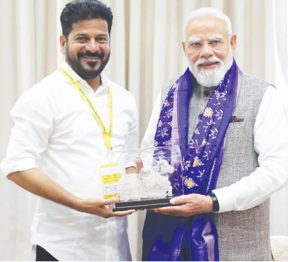
సమంతి సరేంద్ర మోడి అధ్యక్షతన జరిగిన 11వ సీఎం ఆయోగ్ గవర్నర్ కౌన్సిల్ సమావేశంలో ముఖ్యమంత్రి రేవంత్ రెడ్డి పాల్గొని ప్రసంగించారు. ఈ సందర్భంగా రేవంత్ రెడ్డి మాట్లాడుతూ...

న్యూఢిల్లీ, జూన్ 11 (ఎఎన్): దేశ అభివృద్ధికి విద్య, వైద్యమే బలమైన పునాదిని సీఎం ఆయోగ్ సమావేశంలో తెలంగాణ ముఖ్యమంత్రి ఎ. రేవంత్ రెడ్డి స్పష్టం చేశారు. కులగణన తర్వాత తెలంగాణ అభివృద్ధి నమూనాను సీఎం ఆయోగ్ లో ఆయన వివరించారు. విద్యా విప్లవం, నైపుణ్యాభివృద్ధి, ప్రపంచ స్థాయి మౌలిక వసతులపై ప్రత్యేక దృష్టి అవసరమని ముఖ్యమంత్రి వ్యాఖ్యలు చేశారు. కేంద్ర ప్రభుత్వం చెబుతున్న వికసిత్ భారత్ 2047 లక్ష్యాన్ని సాధించాలన్న దేశంలోని ప్రతి విద్యార్థికి, పౌరుడికి నాణ్యమైన విద్య, మెరుగైన వైద్య సేవలు అందుబాటులో ఉండాలని చెప్పారు. గురువారం రాష్ట్రపతి భవన్ లో ప్రధా