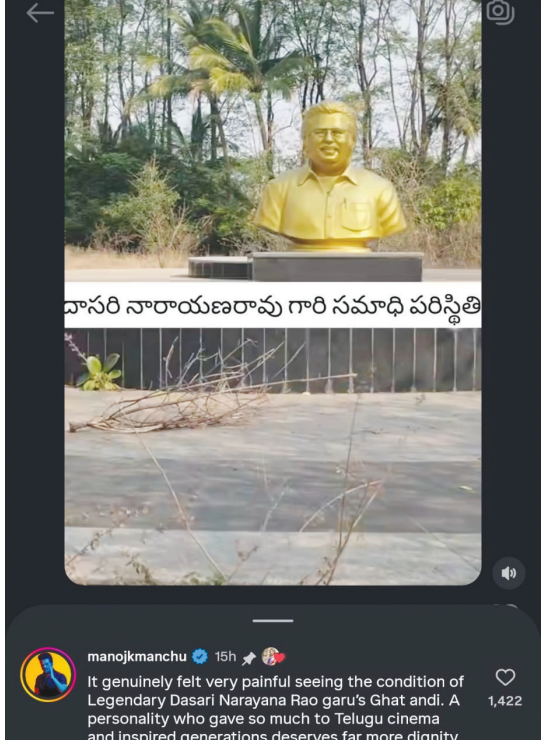
దాసరి నారాయణరావు గారి సమాధి పరిస్థితి