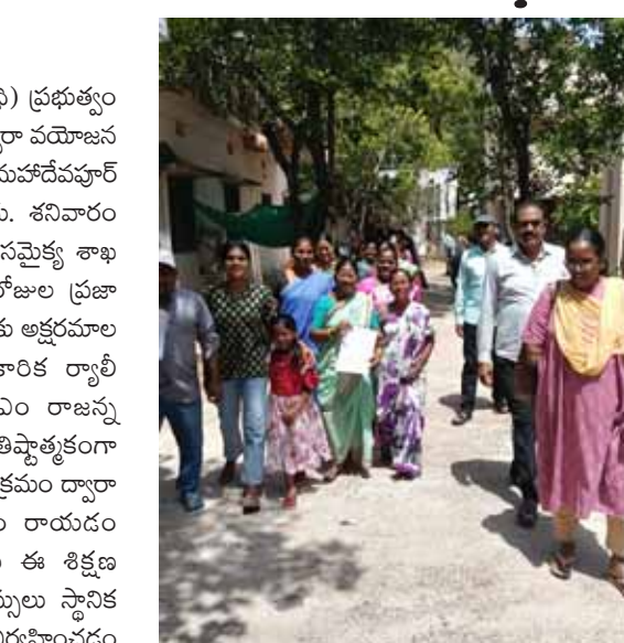
నిరక్షరాస్యులు ప్రతి ఒక్కరు రావడమే కాకుండా చదువు నేర్చుకుని వంద రోజుల్లో అక్షరాస్యులుగా తయారవుతారని అన్నారు ఈ కార్యక్రమంలో అన్ని గ్రామాల నుండి ఉల్లాస ఉత్పల్లెలైన ఎస్ హెచ్ జి మహిళలు తదితరులు పాల్గొన్నారు.