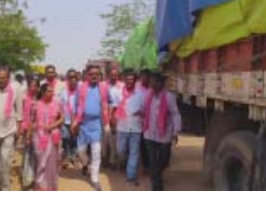
తాను కొట్టుకుంటే ఆ కుటుంబంపై దాడులు చేశారని, చేసిన తప్పుకు మేమే కొట్టుకుంటున్నమని రైతులు అంటున్నారని, కానీ ఆ పరిస్థితి మీకు రాకుండా చూసుకోవాలని ఆయన హితవు పలికారు. కాటారం సబ్ డివిజన్ పోలీసులు అతిగా చేస్తున్నారని అతిత్వంలో జైలుభరో కార్యక్రమానికి శ్రీకారం చుడుతామని మంథని మాజీ ఎమ్మెల్యే పుట్ట మధూకర్ హెచ్చరించారు. మంథనిలో మొదలు అయితే అనుకున్నాం కానీ కాటారంలో మొదలుపెడుతామన్నారు. రైతుల కోసం పోరాటం చేసిన బీఆర్ఎస్ నాయకులపై మీరు కేసులు పెట్టింది చిత్ర హింసలకు గురి చేస్తూ ఉన్నారన్నారు. ఇబ్బంది కాటారం పోలీసులు ఎంతమంది మీద కేసులు పెట్టుకుంటారో పెట్టుకోవడం అన్నారు. అతి త్వరలో కాటారం పోలీస్ స్టేషన్ కు బీఆర్ఎస్ పార్టీ నాయకులంతా వస్తం ఎంతమందిపై కేసులు పెట్టి ఏ జైలుకు పంపినరో పంపించడం అన్నారు. ప్రతిపక్షంగా ప్రజల పక్షాన మాట్లాడుతుంటే మా నాయకులపై కేసులు పెట్టి భయభ్రాంతులకు గురి చేస్తూ అని ఆగ్రహం వ్యక్తం చేశారు. అక్రమ కేసులతో భయభ్రాంతులకు గురిచేస్తున్న పోలీసుల చిట్టా రాసిపెడుతున్నామని, ప్రతి పేరును పింక్ టిక్ లో రాసుకుని మా ప్రభుత్వం రాగానే అమలు చేస్తుమని ఆయన హెచ్చరించారు. ఈ కార్యక్రమంలో నాయకులు కార్యకర్తలు రైతులు పాల్గొన్నారు.

కాటారం మే 29(పుదయం ప్రతినిధి)ఆరుగాలం కష్టపడి పండించిన పంటను కొనుగోలు చేయడం లేదని, లారీలు వస్తే పంటలు ఎమ్మెల్యే స్వగ్రామంలో రైతులు రోడ్లకి గగ్గోలు పెడితే నిమ్మకు నీరెత్తిపట్టుగా వ్యవహరిస్తున్నారని మంథని మాజీ ఎమ్మెల్యే పుట్ట మధూకర్ అసహనం వ్యక్తం చేశారు. శుక్రవారం కాటారం మండలం రేగుల గూడెంలో శ్రీరుద్ర జిన్సింగ్ మిల్ లో గోదాంలో మూడు రోజులుగా అన్వేషించి కొరత యెయిటింగ్ లో ఉన్న లారీలు, మాట్లాడుతున్నామని కేంద్రానికి వచ్చి చూడాలని డిమాండ్ చేశారు. కొండంపేట పత్తి మిల్లుకు వెళ్లే అక్కడ నాలుగు రోజులుగా అన్వేషించి కాకుండా లారీలు నిలిపివేయి ఉన్నాయన్నారు. కాంటా పెట్టి సమయంలో మూడు నాలుగు కిలోల కడింగ్ పెడుతున్నారని, ఇలాంటి పరిస్థితులు ఎప్పుడు లేవన్నారు. ఈ ప్రాంతంలో సంబంధం లేకపోయినా మూడు ఓట్లు ఉన్న కుటుంబానికి 40ఎండ్లు అధికారం ఇప్పించిన గ్రహించాలన్నారు.ఎమ్మెల్యే తమ్ముడిని కల్లాల కాడికి ఎందుకు పంపినట్లవని ప్రశ్నించారు. పదవి ఇచ్చారు కదా ఎందుకు రావడం లేదో సమాజానికి సమాధానం చెప్పాలని డిమాండ్ చేశారు. ఇక్కడ ఇద్దరికి ఉద్యోగాలు ఇవ్వలేదని, రెండు ఇండ్లు ఇవ్వకపోగా కనీసం ఆరుగాలం కష్టపడి పండించిన పంటను కొంటలేదని అయిన ఆవేదన వ్యక్తం చేశారు. రైతుల కష్టాలు చూసి మాట్లాడుతుంటే తిడుతున్నవని బదనా చేస్తున్నారని అన్నారు. గౌరవ్య తన చెప్పితో