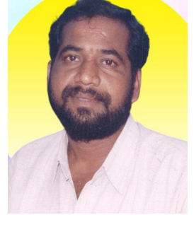
అప్పటి డి.ఆర్.ఎస్.లో చేరి మున్సిపల్ ఎన్నికల్లో డు వాద్ద నుంచి కొన్నింటి

ప్రముఖుల దిగ్భ్రాంతి...సంతాపం నారాయణపేట మే 29 (పుడయం ప్రతినధి)