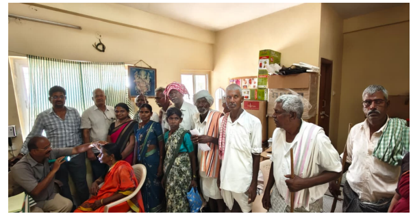
నాగర్ కర్నూల్ మే 28 (పుడయం ప్రతినది)