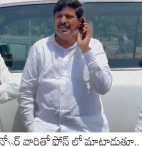
యాలూ మే 28 (పుడయం ప్రతినది)

అధికారులు అప్రమత్తంగా ఉండాలి ఇతర ప్రాంతాలలో స్టాక్ పాయింట్ ఏర్పాటు చేసుకోవాలి తాండూరు మెల్లెస్ మనోహర్ రెడ్డి