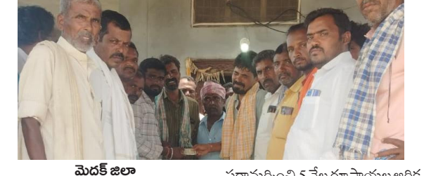
మెడకే జిల్లా పుడయం ప్రతినది