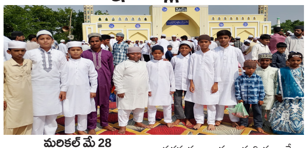
మలకల్ మే 28 (పుడయం ప్రతినది)

మలకల్ మండల కేంద్రంలో మరీయు ధర్మానికే మండల కేంద్రంలో తో పాటు వివిధ గ్రామాల గురువారం ముస్లిం సోదరులు బక్రీద్ పండుగ వేడుకలు సుఖంగా జరుపుకున్నారు. ఉదయం జామత్ మాజిల్ లో ప్రత్యేక ప్రార్థనలు నిర్వహించి మేడియం భక్తులు హాజరయ్యారు. ప్రార్థన అనంతరం ముస్లింలు బక్రీద్ పండుగ పవిత్రత