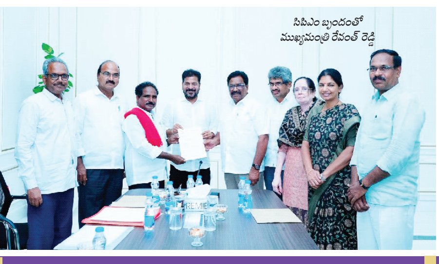
సిపిఎం బృందంలో ముఖ్యమంత్రి రేవంత్ రెడ్డి

* మూసీ నిర్మాణాలు ఎవరూ ఆందోళన చెందాల్సిన అవసరం లేదు. స్థానికంగానే నివాసాలు మంజూరు చేస్తాము. ఈ విషయంలో పార్టీలు రాజకీయం చేయడం తగదు. మూసీ పునరుజ్జీవం చేసే అద్భుతమైన పథకాలకు ప్రాంతంగా తీర్చిదిద్దటమే మూసీ కాలవలకు నల్గొండ జిల్లా ప్రజలకు జీవన్మరణ సమస్యగా మారింది. మూసీ పునరుజ్జీవం ప్రాజెక్టు వల్ల యువతకు ఉపాధి లభించడమే కాకుండా నగర ప్రజల జీవన విధానం మెరుగువుతుంది. ప్రభుత్వ విద్యను ప్రజాకన చేస్తున్నాము. నాణ్యమైన విద్య అందించే లక్ష్యంతో ముందుకు వెళ్తున్నామని, అందులో భాగంగా విద్యార్థులకు నాణ్యమైన బ్రేక్ ఫాస్ట్, భోజనం అందిస్తున్నాం. - ముఖ్యమంత్రి రేవంత్ రెడ్డి