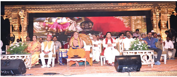
మహాదేవపూర్ మే 22 (పుడయం ప్రతినిధి)

కళాకారులను అభినందించిన రాష్ట్ర గవర్నర్ శివ ప్రతాప్ శుక్లా. కళాకారులను అభినందించిన రాష్ట్ర గవర్నర్ శివ ప్రతాప్ శుక్లా. కళాకారులను అభినందించిన రాష్ట్ర గవర్నర్ శివ ప్రతాప్ శుక్లా. కళాకారులను అభినందించిన రాష్ట్ర గవర్నర్ శివ ప్రతాప్ శుక్లా.