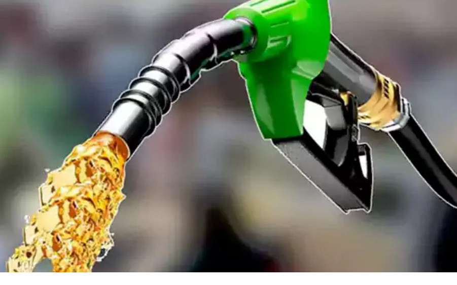
మరోవైపు దేశంలోని అతిపెద్ద పాల ఉత్పత్తుల రిటైలర్లు అయిన అమూల్, మదర్ డెయిరీ లీటరుకు రూ. 2 కొప్పగున పాల ధరలు పెంచడంతో వినియోగదారుల గ్రహణ బద్ధితే పై భారం పడింది. దీనివల్ల ప్రాంతీయ డెయిరీ సంస్థలు కూడా ధరలను విపరీతంగా పెంచే అవకాశం ఉంది. ఇండస్, వంటగ్యాస్, పాల ధరల పెరుగుదల వల్ల రాబోయే నెలల్లో రిటైల్ ప్రవ్యూల్స్ ఇంకా సైతం 0.42 శాతం పెరిగి అవకాశం ఉందని ఆర్థికవేత్తలు హెచ్చరించారు.

దేశవ్యాప్తంగా పెట్రోల్, డీజిల్ ధరలు (Petrol-Diesel prices) పెరిగాయి. లీటరు పెట్రోల్, డీజిల్ పై సగటున రూ. 3 పెంపు తూక్రవారం అయితే కంపెనీలు నిర్ణయం తీసుకున్నాయి. అయితే భవిష్యత్తులో ఈ ధరలు మరింత పెరిగి అవకాశం ఉందని ఆర్థికవేత్తలు హెచ్చరిస్తున్నారు. అమెరికా-ఇరాన్ ఉద్దిక్తతల ఇంకా చలారలేదని, దీంతో రాబోయే రోజుల్లో ఇండస్ ధరల పెంపు మరింత ఎక్కువగా ఉండొచ్చని అంచనా వేశారు. చమురు కంపెనీలు ప్రస్తుతం ఎదుర్కొంటున్న ఆర్థిక నష్టాల నుంచి బయటపడడానికి రూ. 3 పెంపు చాలదని.. లిటర్ పెట్రోల్, డీజిల్ ధర రూ. 10 వరకు పెరుగుతుంది అంటే గ్రోబల్ విశేషకులు పేర్కొన్నారు. ఈ పెంపు ఒకేసారి గానీ లేదా 2-3 వారాల్లో దశలవారిగా గానీ ఉండొచ్చన్నారు. పశ్చిమాసియాలో నెలకొన్న భౌగోళిక రాజకీయ, ఉద్దిక్తతలు.. నిరంతర సంక్షోభం వల్ల అంతర్జాతీయ మార్కెట్లో ముడిచమురు సరఫరాపై తీవ్ర ఒత్తిడి నెలకొంది. దీంతో ధరల పెరుగుదలను నియంత్రించడానికి కేంద్ర ప్రభుత్వం పెట్రోల్, డీజిల్ పై ఎక్సైజ్ సుంకం వసూలును తాత్కాలికంగా నిలిపివేసింది. అలాగే ప్రభుత్వ రంగ చమురు కంపెనీలు కూడా తమ లాభాలను మలుపుకుని అధిక వ్యయాన్ని సొంతంగా భరించాయి. ఈ విషయాలపై పరిశీలనల కారణంగా ఇండస్ ధరలను రూ. 3కి పెంచడం తప్పలేదు. అయినప్పటికీ ఈ స్వల్ప పెరుగుదల కంపెనీలు రోజువారీ నష్టాలను కొంతమేర తగ్గించింది తప్ప, పూర్తిగా తొలగించలేకపోయింది.