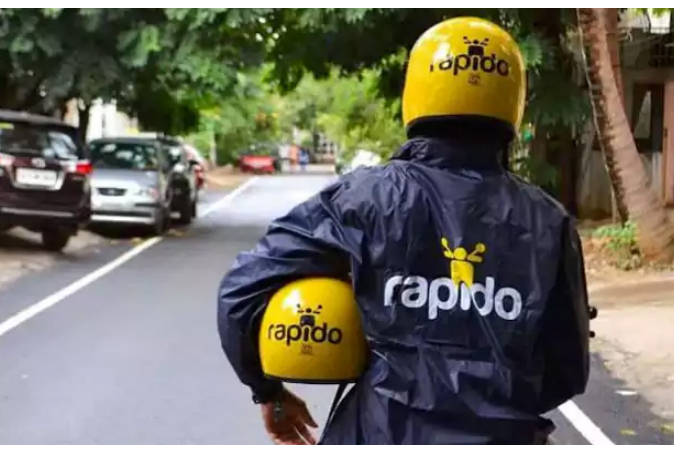
అప్పీల్ చేశాయి. విచారణ అనంతరం న్యాయస్థానం ఆ తీర్పును పక్కన పెట్టింది. మోటార్ వాహన చట్టం ప్రకారం బైక్ ట్యాక్సీలను రవాణా వాహనాలుగా పరిగణిస్తూ, చట్టబద్ధమైన అనుమతులతో నడుపుకోవచ్చని అనుమతి ఇచ్చింది.

మహారాష్ట్రలో క్యాబ్, రైడ్ సేవలు నిలిచిపోతున్నాయి. తమ యాప్ స్టోర్స్ నుంచి ఓటా, ఉబెర్, ర్యాపిడ్ యాప్స్ ను తొలగించాలంటూ యాపిల్, గూగుల్ కు మహారాష్ట్ర సీట్ సైబర్ డిపార్ట్ మెంట్ నోటీసులు జారీ చేసింది. అక్రమంగా బైక్ ట్యాక్సీ సేవలను నిర్వహిస్తున్నట్లు ఆరోపణలు రావడంతో రాష్ట్ర ప్రభుత్వం ఈ చర్యలు చేపట్టింది. బైక్ ట్యాక్సీ అగ్రిగేటర్లపై చర్యలు తీసుకోవాలంటూ మహారాష్ట్ర రవాణా శాఖ మంత్రి ప్రతాప్ సర్కారుకి సైబర్ విభాగానికి లేఖ రాశారు. ఈ నెపథ్యంలోనే గూగుల్, యాపిల్ సంస్థలకు సైబర్ విభాగం నోటీసులు జారీ చేసింది. ఈ యాప్స్ వేదికగా చట్టవిరుద్ధంగా బైక్ సర్వీసులు అందుతున్నాయని వాటిల్లో అధికారులు పేర్కొన్నారు. రవాణా శాఖ, మోటార్ వాహనాల నిబంధనలు పాలించకుండా ఈ రైడ్ సేవలను నడుపుతున్నాయని వెల్లడించారు. కర్రాటక కూడా గతంలో ఈ తరహా ఆదేశాలు ఇచ్చింది. మోటార్ వేహికల్ చట్టంలో బైక్ ట్యాక్సీల (Bike taxi services) ప్రయాణం లేకపోవడంతో హైకోర్టు ఆదేశాల మేరకు ఆ రాష్ట్రంలో బైక్ ట్యాక్సీ సేవలు నిలిచిపోయాయి. తర్వాత ఓటా, ఉబెర్ వంటి సంస్థలు డివిజన్ బెంచ్ లో