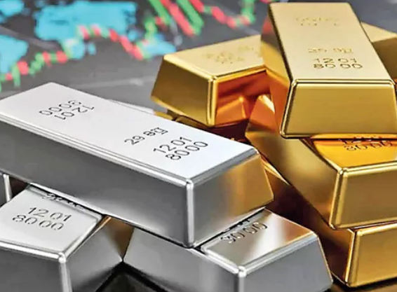
మనదేశంలోకి పసిడి, వెండి దిగుమతులు ఏప్రిల్లో భారీగా పెరిగాయి. ఈ లోహాలపై కచ్చితమైన సూచనలు పెంచినందున, యూఏఈకి ఇప్పటికే టారిఫ్ కోటా మినహాయింపు (టీఆర్కెయూ) వాటా ఇందులో 8.58 టన్నులే

ఉందని అగ్రార్కాల్ తెలిపారు. 2025-26లో వెండి దిగుమతులు 150% వృద్ధితో 12 బి. డాలర్లకు చేరుకున్నాయి. సరిహద్దు పరంగా 42% పెరిగి 7334.96 టన్నులుగా నమోదైంది. ఏప్రిల్లో మొత్తం భారత దిగుమతులు 13.78% పెరిగి 43.56 బి. డాలర్ల (సుమారు రూ. 4 లక్షల కోట్ల)కు చేరుకున్నాయి. వృద్ధి పరంగా ఇది 5 నెలల గరిష్టం కాగా, పరిమాణం పరంగా వాల్యుమ్లోనే అత్యధిక నెలవారీ ఎగుమతులు ఇవే. అయితే దిగుమతులు కూడా 10% పెరిగి 71.94 బి. డాలర్ల (సుమారు రూ. 6.76 లక్షల కోట్ల)కు చేరుకోవడంతో వాణిజ్య లోటు ఏప్రిల్లో మూడు నెలల గరిష్టమైన 28.38 బి. డాలర్ల (రూ. 2.66 లక్షల కోట్ల)కు చేరుకుంది. అంతర్జాతీయ భౌగోళిక రాజకీయ ఉద్దిక్తతల నడుమ, దేశ ఎగుమతులు అలోగ్యతర వృద్ధిని సమాధానం చేశాయని వాణిజ్య కార్యదర్శి రాజేష్ అగ్రార్కాల్ పేర్కొన్నారు. ఎలక్ట్రానిక్స్ వస్తువులు (40.31%), మాంసం, డెయిరీ (48%), పెట్రోలియం ఉత్పత్తులు (34.66%), ఇంజనీరింగ్ వస్తువులు (8.76%), ఫార్మా (7.12%) వంటివి రాజీంచడంతో దిగుమతుల్లో మంచి వృద్ధి సాధ్యమైంది.