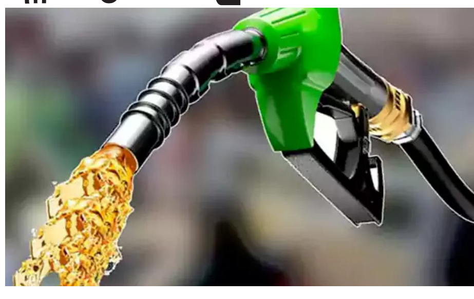
మరోవైపు దేశంలోని అతిపెద్ద పాల ఉత్పత్తుల రిఫైనర్లు అయిన అమూల్, మదర్ డెయిరీ లీటరుకు రూ. 2 కొప్పలను పాల ధరలు పెంచడంతో వినియోగదారుల గ్రహణ బద్ధితే పై భారం పడింది. దీనివల్ల ప్రాంతీయ డెయిరీ సంస్థలు కూడా ధరలను విపరీతంగా పెంచే అవకాశం ఉంది. ఇండస్, వంటగ్యాస్, పాల ధరల పెరుగుదల వల్ల రాబోయే నెలల్లో రిఫైన్డ్ ప్రవ్యూల్జులు సైకిల్ 0.42 శాతం పెరిగి అవకాశం ఉందని ఆర్థికవేత్తలు హెచ్చరించారు.

దేశవ్యాప్తంగా పెట్రోల్, డీజిల్ ధరలు (Petrol-Diesel prices) పెరిగాయి. లీటరు పెట్రోల్, డీజిల్ పై సగటున రూ. 3 పెంపు తూక్రవారం అయితే కంపెనీలు నిర్ణయం తీసుకున్నాయి. అయితే భవిష్యత్తులో ఈ ధరలు మరింత పెరిగి అవకాశం ఉందని ఆర్థికవేత్తలు హెచ్చరిస్తున్నారు. అమెరికా-ఇరాన్ ఉద్రిక్తతలను ఇంకా చలారలేదని, దీంతో రాబోయే రోజుల్లో ఇండస్ ధరల పెంపు మరింత ఎక్కువగా ఉండొచ్చని అంచనా వేశారు. చమురు కంపెనీలు ప్రస్తుతం ఎదుర్కొంటున్న ఆర్థిక సమస్యల నుంచి బయటపడడానికి రూ. 3 పెంపు చాలదని.. లిటర్ పెట్రోల్, డీజిల్ ధర రూ. 10 వరకు పెరుగుతుంది అంటే గ్లోబల్ విశ్లేషకులు పేర్కొన్నారు. ఈ పెంపు ఒకేసారి గానీ లేదా 2-3 వారాల్లో దశలవారిగా గానీ ఉండొచ్చున్నారు. పశ్చిమాసియాలో నెలకొన్న భౌగోళిక రాజకీయ, ఉద్రిక్తతలు.. నిరంతర సంక్షోభం వల్ల అంతర్జాతీయ మార్కెట్లో ముడిచమురు సరఫరాపై తీవ్ర ఒత్తిడి నెలకొంది. దీంతో ధరల పెరుగుదలను నియంత్రించడానికి కేంద్ర ప్రభుత్వం పెట్రోల్, డీజిల్ పై ఎక్సైజ్ సుంకం వసూలును తాత్కాలికంగా నిలిపివేసింది. అలాగే ప్రభుత్వ రంగ చమురు కంపెనీలు కూడా తమ లాభాలను మదులుకుని అధిక వ్యయాన్ని సొంతంగా భరించాయి. ఈ వివరాలపై పరిశీలనల కారణంగా ఇండస్ ధరలను రూ. 3కి పెంచడం తప్పలేదు. అయినప్పటికీ ఈ స్వల్ప పెరుగుదల కంపెనీలు రోజువారీ సప్లయ కోసం కేంద్రపాలనా కమిషన్ తప్ప, పూర్తిగా తొలగించలేకపోయింది.