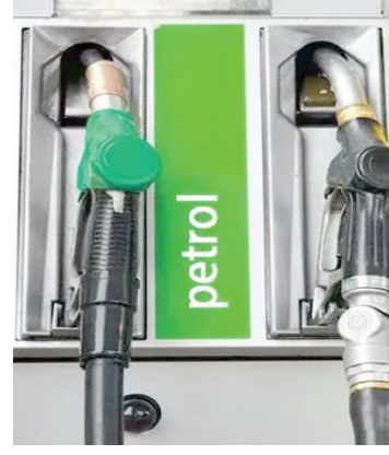
హైదరాబాద్, మే 16 : ధోబల్ విశ్లేషకులు పేర్కొన్నారు. అయితే ఈ పెంపు ఒకేసారి లేదా దశలవారిగా ఉండవచ్చని అభిప్రాయపడ్డారు. మిగతా 2లో..

హైదరాబాద్, మే 16 : భారతదేశంలో పెట్రోల్, డీజిల్ ధరలు లీటర్ పై రూ.10 వరకు పెరిగే అవకాశముందని ఎంకే