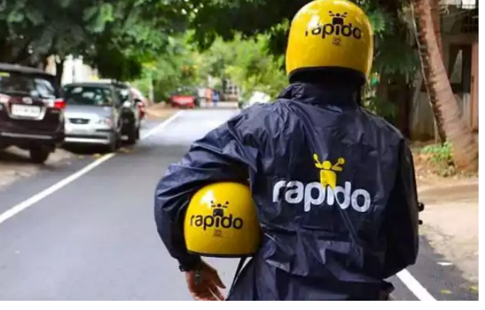
అప్పీల్ చేశాయి. విచారణ అనంతరం న్యాయస్థానం ఆ తీర్పును పక్కన పెట్టింది. మోటార్ వాహన చట్టం ప్రకారం బైక్ ట్యాక్సీలను రవాణా వాహనాలుగా పరిగణిస్తూ, చట్టబద్ధమైన అనుమతులతో నడుపుకోవచ్చని అనుమతి ఇచ్చింది.

మహారాష్ట్రలో క్యాబ్, రైడ్ సేవలు నిలిచిపోతున్నాయి. తమ యాప్ స్టోర్స్ నుంచి ఓటా, ఉబెర్, ర్యాపిడ్ యాప్స్ ను తొలగించాలంటూ యాపిల్, గూగుల్ కు మహారాష్ట్ర సీట్ సైబర్ డిపార్ట్ మెంట్ నోటీసులు జారీ చేసింది. అక్రమంగా బైక్ ట్యాక్సీ సేవలను నిర్వహిస్తున్నట్లు ఆరోపణలు రావడంతో రాష్ట్ర ప్రభుత్వం ఈ చర్యలు చేపట్టింది. బైక్ ట్యాక్సీ అగ్రిగేటర్లపై చర్యలు తీసుకోవాలంటూ మహారాష్ట్ర రవాణా శాఖ మంత్రి ప్రతాప్ సర్కారుకి సైబర్ విభాగానికి లేఖ రాశారు. ఈ నెపథ్యంలోనే గూగుల్, యాపిల్ సంస్థలకు సైబర్ విభాగం నోటీసులు జారీ చేసింది. ఈ యాప్స్ వేదికగా చట్టవిరుద్ధంగా బైక్ సర్వీసులు అందుతున్నాయని వాటిల్లో అధికారులు పేర్కొన్నారు. రవాణా శాఖ, మోటార్ వాహనాల నిబంధనలు పాలించకుండా ఈ రైడ్ సేవలను నడుపుతున్నాయని వెల్లడించారు. కర్రాటక కూడా గతంలో ఈ తరహా ఆదేశాలు ఇచ్చింది. మోటార్ వేహికల్ చట్టంలో బైక్ ట్యాక్సీల (Bike taxi services) ప్రస్తావన లేకపోవడంతో సైబర్ ప్రభుత్వం ఆదేశాల మేరకు ఆ రాష్ట్రంలో బైక్ ట్యాక్సీ సేవలు నిలిచిపోయాయి. తర్వాత ఓటా, ఉబెర్ వంటి సంస్థలు డివిజన్ బెంచ్ లో