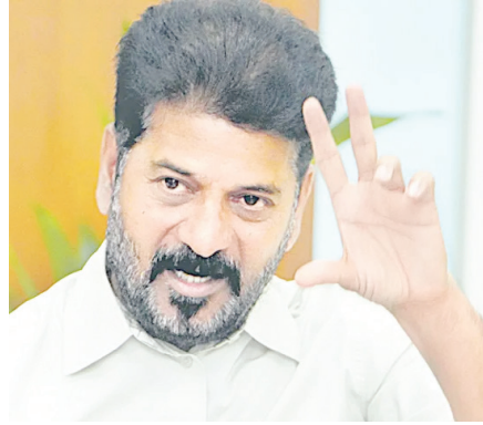
హైదరాబాద్, మే 16 :

దేశవ్యాప్తంగా ఇంధన ధరల పెంపు విశ్వాస ఘాతుకమని సీఎం రేవంత్ రెడ్డి వ్యాఖ్యానించారు. తక్షణమే ఆ నిర్ణయాన్ని ఉపసంహరించుకోవాలని డిమాండ్ చేశారు. ఈ మేరకు శనివారం ఆయన ఎక్స్ వేదికగా కేంద్ర ప్రభుత్వంపై మం డిషన్లు. ధరల పెంపు నిర్ణయం సామాన్యుల పాలిటా పడు