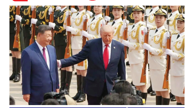
హరూజ్ జలసంధిపై వైట్ హౌస్ కీలక ప్రకటన