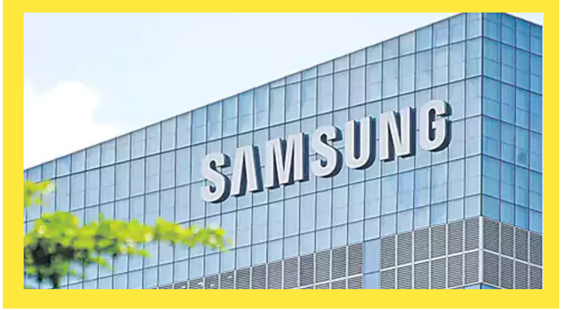
హార్వేసు దాటి పరుగులు పెడుతోంది. ఆర్టిఫిషియల్ ఇంటెలిజెన్స్ (AI) వికాసాల అంతకంతకూ విస్తరి

ప్రముఖ ఎలక్ట్రానిక్ ఉత్పత్తుల సంస్థ శాంసంగ్ షేర్లు భారీగా పెరిగాయి. బుద్ధవారం ఈ కంపెనీ షేర్లు ఏకంగా 15 శాతం పెరగడంతో, మార్కెట్ విలువ 1 ట్రిలియన్ డాలర్ (రూ.95 లక్షల కోట్లకు పైగా)