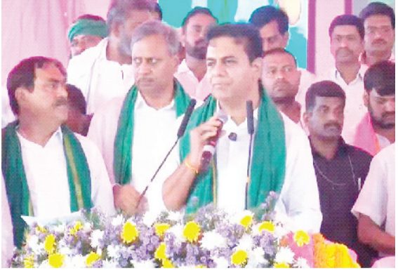
హైదరాబాద్, మే 06 (పుడయం ప్రతినిధి) : అసెంబ్లీ ఎన్నికల ప్రచారంలో భాగంగా రాష్ట్ర రైతులకు అనేక వాగ్దానాలు చేసిన విస్తరించిన రాహుల్

కేటీఆర్ ఏకరాకు రూ. 10 వేలు ఇస్తే, తాము రూ. 15 వేలు ఇస్తామని కాంగ్రెస్ చేసిన వాగ్దానం అమలు కావడం లేదు. అధికారంలోకి వచ్చి రెండున్నరేళ్లు అవుతోన్నా ఇప్పటి వరకు రైతులకు పూర్తి స్థాయిలో న్యాయం జరుగడం లేదు. ఇప్పటి వరకు 69 సార్లు ఢిల్లీ వెళ్లి వచ్చిన సీఎం రేవంత్ రెడ్డి రాష్ట్ర రైతుల కోసం 69 పైసలైనా తెచ్చారా? - కేటీఆర్ గాంధీ, రేవంత్ రెడ్డి ఫోటోలను పోలీస్ స్టేషన్లలో అంటించి 'దొంగలొస్తున్నారూ జాగ్రత్త' అని రాయాలని బీఆర్ఎస్ వర్కొంగ్ ప్రెసిడెంట్ కేటీఆర్ కీలక వాగ్దానాలు చేశారు. కాంగ్రెస్ గ్యాంగ్.. చెడ్డీ గ్యాంగ్ కంటే చాలా ప్రమాదకరమని వ్యాఖ్యానించారు. ఎన్నికల ప్రచారంలో భాగంగా వరంగల్ వేదికగా కాంగ్రెస్ పార్టీ ప్రకటించిన రైతు డిక్లరేషన్.. ఓ బోగస్ పత్రమన్న ఆయన అది కేవలం చిత్తు కాగితమని విమర్శించారు. కాంగ్రెస్ నిర్వహిస్తున్నది 'రైతు మేళా' కాదు, అది ఒక 'దగా మేళా' అని సంబోధించారు. బుధవారం వరంగల్ లో బీఆర్ఎస్ ఆధ్వర్యంలో నిర్వహించిన రైతు సంగ్రామ సదస్సులో కేటీఆర్ మాట్లాడారు. రైతు డిక్లరేషన్ పేరిట కాంగ్రెస్ పార్టీ సయవంచనకు పాల్పడిందని ఆరోపించారు. నాలుగేళ్ల క్రితం ఇదే వరంగల్ గడ్డపై కాంగ్రెస్ పెద్దలు వచ్చి 'రైతు డిక్లరేషన్' ప్రకటించారని కేటీఆర్ గుర్తు చేశారు. 60 ఏళ్ల పాటు రైతుల రక్తం తాగిన కాంగ్రెస్ పార్టీ, ఎన్నికల ముందు మాత్రం కొంగజపం చేసినందని ఎద్దేవా చేశారు. రైతు డిక్లరేషన్లో అన్నదాతలకు ఇచ్చిన 34 హామీలు ఏమయ్యాయని ప్రశ్నించారు. కాంగ్రెస్ మాటలు నమ్మి ఓట్లు వేసిన రైతులు నేడు అరిగోస పడుతున్నారని ఆవేదన వ్యక్తం చేశారు.