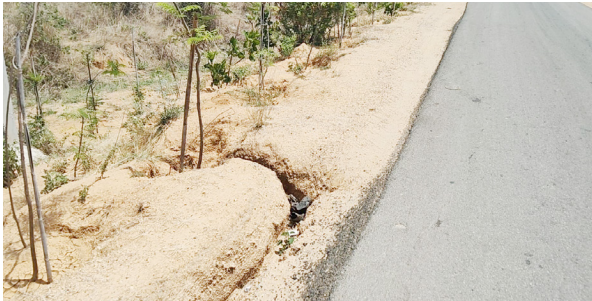
జనారం, మే 3 (పుడయం ప్రతినిధి) :

జనారం మున్సిపాలిటీ పరిధిలోని కొడకంచి నుంచి ఇంద్రేశం చెళ్ల రోడ్డు దెక్కన్ అటో పరిశ్రమకు కూతవేట దారిలో కోతకు గురైంది. రాత్రింబ వళ్లు ప్రయాణాలు సాగించే వాహన దారులు ప్రయాణికులు కోతకు గురైన రోడ్డుతో ఆందోళన వ్యక్తం చేస్తున్నారు. ప్రాణం పోతే గాని స్పందించరా అంటూ వాహనదారులు మండిపడు తున్నారు. గతంలో కురిసిన వర్షాలకు