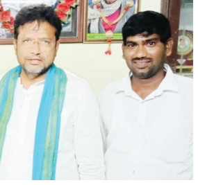
మంథని, మే 03 వృద్ధయం:

- మంథని నియోజకవర్గానికి రూ. 15 కోట్ల మంజూరుపై హర్షం