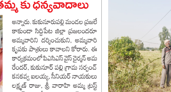
దుబ్బాక, మే 03 (పుడయం):

వ్యవసాయ పంట పొలాల్లో చేతికి తాకేంత ఎత్తులో వేలాడుతున్న కరెంట్ తీగలు రైతులకు ప్రాణ సంకటంగా మారాయి. మిరదొడ్డి మండలం ధర్నారం గ్రామంలో ఈ తీగల కింద వ్యవసాయం చేయాలి. ఇప్పటికైనా సంబంధిత అధికారులు స్పందించి ప్రమాదకరంగా వేలాడుతున్న కరెంట్ తీగలను వెంటనే సరిచేసి రైతుల ప్రాణాలను కాపాడాలని బాధితుల రైతుల కోరుతున్నారు. నిర్లక్ష్యం వల్ల ఏదైనా ప్రమాదం జరిగితే ఎవరు బాధ్యత వహిస్తారని గ్రామస్థులు ప్రశ్నిస్తున్నారు.