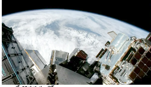
మే 03 వుదయం దెస్య:

దెంగళూరుకు చెందిన అంతరిక్ష అంకర సంస్థ గెలాక్సీ పంపించిన 'దృష్టి' ఉపగ్రహం నింగిలోకి దూసు కెళ్లింది. కాలిఫోర్నియాలోని ప్రయోగ కేంద్రం నుంచి ఫాల్కన్ 9 రాకెట్ సాయంతో విజయవంతంగా కక్ష్యలోకి ప్రవేశపెట్టినట్లు గెలాక్సీ వెల్లడించింది. ఇది ప్రపంచంలో ఆస్ట్రోసాట్ సాంకేతిక కలిగిన మొట్టమొదటి ఉపగ్రహమని పేర్కొంది. భూ పరిశీలన సాంకేతికత పరిణామంలో ఇది కీలక మైలురాయి అని తెలిపింది. "190 కిలో బరువున్న ఈ ఉపగ్రహం... భారత్ లోని ప్రైవేటు సంస్థ నిర్మించిన శాటిలైట్లలో అతిపెద్దది. 1.5 మీటర్ల రెజల్యూషన్ చిత్రాలను అందిస్తుంది. ఆస్ట్రోసాట్ టెక్నాలజీతో ఇది ఎవెర్ గ్రేడ్ రాడార్ సెన్సర్లతో కలిపి పరిశీలనలు సాగిస్తుంది. అన్నిరకాల వాతావరణ పరిస్థితుల్లో... పగలు, రాత్రి తేడా లేకుండా భూమిని నిరంతరం పరిశీలించే సామర్థ్యం దీని సొంతం" అని గెలాక్సీ పేర్కొంది. గెలాక్సీ యొక్క దృష్టి ఉపగ్రహం విజయవంతంగా కక్ష్యలోకి ప్రవేశపెట్టడం పట్ల ప్రధాని మోదీ హర్షం వ్యక్తం చేశారు. భారత అంతరిక్ష పరిశోధనలో ఇదే కీలక విజయంగా నిలుస్తుందన్నారు. దేశ పురోగతి, అవిచ్ఛిన్నత పట్ల యువత ఆసక్తిని కలిగి ఉన్నట్లు నిరదర్శనమన్నారు. ఈ సందర్భంగా గెలాక్సీ బృందానికి ప్రధాని మోదీ శుభాకాంక్షలు తెలిపారు.