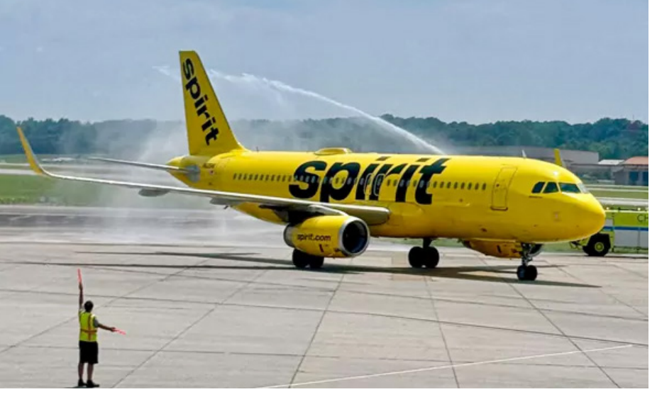
ఎటువంటి ఆర్థిక సాయం అందకపోవడంతో సర్వీసులను నిలిపివేయాలని నిర్ణయించుకుంది. తమ ఎయిర్లైన్స్ మానివేత వల్ల సుమారు 17వేల మంది ఉద్యోగులపై ఈ ప్రభావం పడుతుందని స్పిరిట్ న్యాయవాది మార్ట్ హ్యూజ్ పేర్కొన్నారు. ఇది చదవండి: విమాన ఇంధన ధర పెరిగింది

ఇంద్ర కౌరవ, పెరుగుతున్న జెట్ ఇంధన ధరల కారణంగా పలు విమానయాన సంస్థలు తీవ్ర సమస్యలు ఎదుర్కొంటున్నాయి. కొన్ని విమానయాన సంస్థలు తమ సర్వీసులను తగ్గించుకుంటుండగా.. మరొకొన్ని టిక్కెట్లు రద్దు పెంచుతున్నాయి. ఈ నేపథ్యంలో అమెరికా (USA)కు చెందిన విమానయాన సంస్థ స్పిరిట్ (Spirit Airlines) కీలక నిర్ణయం తీసుకుంది. తమ సర్వీసులను శాశ్వతంగా నిలిపివేస్తున్నట్లు ప్రకటించింది. ఈ నిర్ణయాన్ని తక్షణమే అమలుచేయమని స్పెట్లు వెల్లడించింది. అన్ని విమాన సర్వీసులను రద్దు చేశామని.. ఇప్పటికే టిక్కెట్లు బుక్ చేసుకున్న ప్రయాణికులకు డబ్బు తిరిగి చెల్లిస్తామని తెలిపింది. అయితే ఇతర విమానయాన సంస్థల్లో ప్రయాణ బుకింగ్ లకు ఎలాంటి సాయం చేయబోమని స్పష్టం చేసింది. 34 ఏళ్లుగా స్పిరిట్ ఎయిర్లైన్స్ తమకు చార్జీలతో ప్రయాణికులకు సౌకర్యవంతమైన సేవలు అందిస్తోంది. రోజూ వందలాది సర్వీసులను సుదూర్లుగా సుమారు 17,000 మందికి ఉపాధి కల్పించింది. కొవిడ్ తర్వాత పెరిగిన నిర్లభణ ఖర్చుల వల్ల ఈ ఎయిర్లైన్స్ పలు ఆర్థిక సమస్యలు, అప్పులతో ఇబ్బందులు పడుతోంది. ఇరాన్ యుద్ధం వల్ల జెట్ ఇంధన ధరలు అకాశాన్నంటడంతో.. ప్రస్తుతం ఈ విమానయాన సంస్థ దివాలా తీసే పరిస్థితికి వచ్చింది. ఆగస్టు 2025 నాటికి స్పిరిట్ ఎయిర్లైన్స్ కు 8.1 బిలియన్ డాలర్ల అప్పులు, 8.6 బిలియన్ డాలర్ల అప్పులు ఉన్నట్లు వెల్లడిస్తోంది. ఈ పరిస్థితి నుంచి రక్షణ కల్పించాలని అమెరికా ప్రభుత్వాన్ని కోరినప్పటికీ