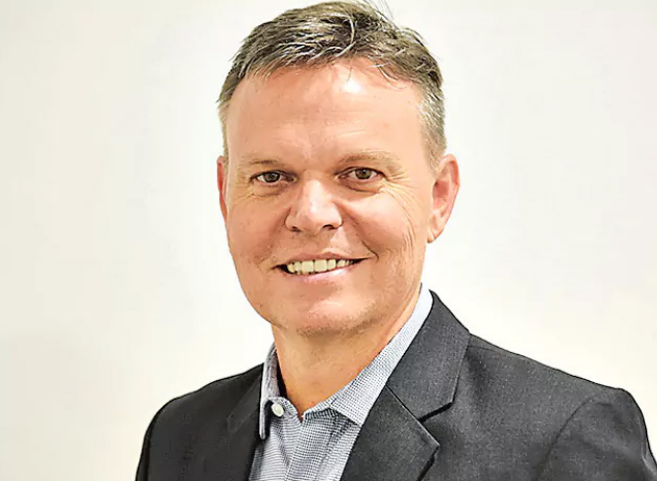
టర్స్ పాలసీల వైపు ఎక్కువగా మొగ్గు చూపుతున్నారన్నారు. మధ్యతరగతి వారిపైనే తమ సంస్థ దృష్టి పెట్టేదని, సగటు ప్రీమియం రూ.27,000 వరకే ఉందని చెప్పారు. రూ.15 లక్షల లోపు వారికూ దాదాపు ఉన్నవారి నుంచి 60% వ్యాపారం వస్తోందన్నారు. సాంకేతికతను ఉపయోగించుకుంటూ, 98.57% కెయిం సెటిల్మెంట్ నిష్పత్తితో సాగుతున్నట్లు తెలిపారు.