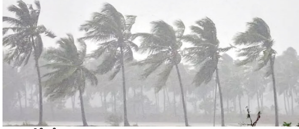
డీటీ, మే 2 (వృద్ధయం):

మే 14 లేదా 15న అండమాన్ ను తాకనున్న రుతుపవనాలు