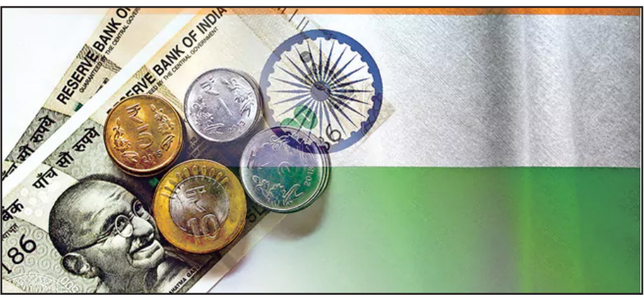
పశ్చిమాసియా సంక్షోభం కారణంగా ఆర్థిక ఒత్తిళ్లు ఉన్నప్పటికీ, దేశ వృద్ధిరేటు జోరును కొనసాగించడానికి ప్రస్తుత ఆర్థిక సంవత్సరంలో ప్రతిపాదించిన రూ.12.22 లక్షల కోట్ల మూలధన వ్యయాలను తగ్గించడోమని ఆర్థిక శాఖ స్పష్టం