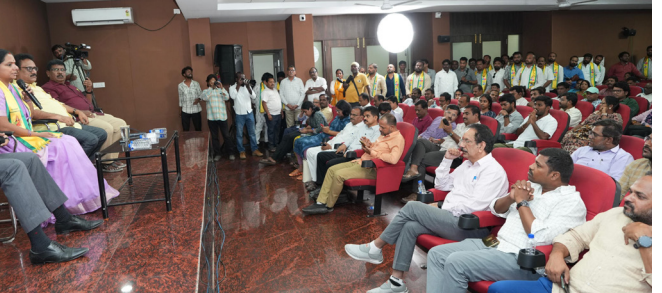
చేయాలన్న సంకల్పం వస్తుందన్నారు. ఇప్పుడున్న ప్రభుత్వానికి అది చేతకావటం లేదన్నారు. చెయ్యి రోజుల్లో ఈ ప్రభుత్వాన్ని గద్దె దించుతామని చెప్పారు. తాము అధికారంలోకి వచ్చాక తల్లి మాదిరి పాలన చేస్తామన్నారు.

స్థూపం వద్ద స్టాంబానికి కట్టిన కొట్లాటలని కల్లుకుంట్ల కవిత తెలిపారు. అన్ని విషయాలలో సాధ్యాసాధ్యాలను పరిశీలించిన తర్వాత చోమీలు ఇచ్చానని చెప్పారు. గత 20 ఏళ్లుగా తనను చూస్తున్నారని ఇచ్చిన మాట, పట్టిన తోపను విడవకుండా ఉన్నానని అన్నారు. తెలంగాణలో విద్య, వైద్యం కోసం ప్రజలు 60 శాతం డబ్బు ఖర్చు చేయాలిస్తే దుస్థితి ఉందని అవేదన వ్యక్తం చేశారు. ప్రభుత్వం చెప్పితేగానూ సంకల్పం తీసుకుంటే ఇది సాధ్యమేనని చెప్పారు. ఆలోచ్య శ్రీ ప్రారంభిస్తున్నది, విద్యార్థులకు ప్రీ మీర్స్ కు సరిగ్గా వారుకొని ఉండే రైతుల చెలిత్ చేశారు. పాఠశాలస్థాయిలోని ఐదు అంశాలు... అమలు చేయటంపై ఆర్థిక నిపుణులతో చర్చలు జరిపానని కవిత చెప్పారు. ప్రభుత్వానికి వచ్చే ఆదాయంలో లక్ష కోట్ల రూపాయలను తమ ప్రాధాన్యత అంశాలకు ఖర్చు చేయవచ్చన్నారు. ఆ విధంగా చూస్తే చేయాలన్న సంకల్పం ఉంటే చాలు ఇదంతా సాధ్యమేనని స్పష్టం చేశారు. తల్లిదండ్రులు తమ పరిశ్రమి చెందుతానంటే చాలా మంది విమర్శలు చేశారని కవిత గుర్తు చేశారు. ఇవ్యాక ప్రజలు తీవ్రంగా ఇబ్బందులు పడుతున్నారని చెప్పారు. కాంగ్రెస్ ప్రభుత్వం అమానుష యంగా వ్యవహరిస్తూ ప్రజలను ఇబ్బంది పెడుతుందని అవేదన వ్యక్తం చేశారు. ఒక తల్లి మాదిరిగా ఆలోచిస్తే మాత్రమే ప్రజలకు మేలు