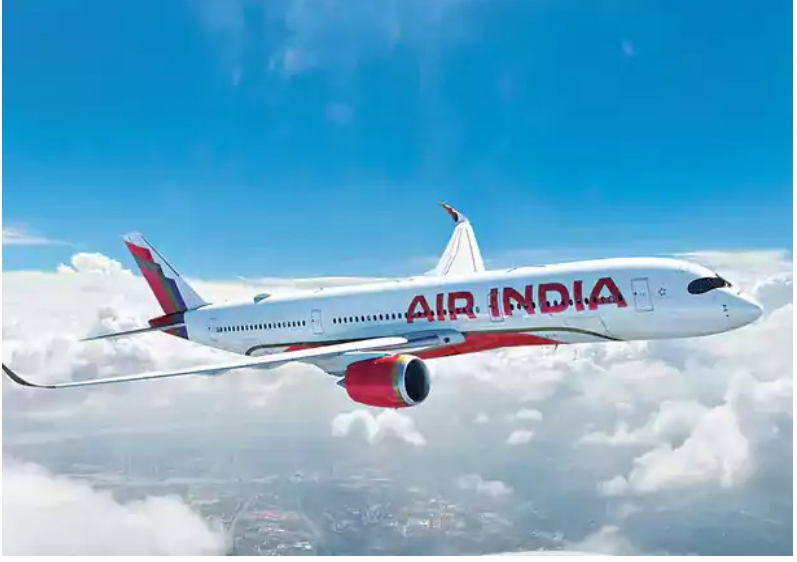
మారతాయని విమానయాన సంస్థలు ఆండోళన వ్యక్తం చేస్తున్నాయి. ఇటీవల కొన్ని మార్గాల్లోనే ఏటిఎఫ్ ధరలు దాదాపు 80 ధరలను మాత్రం ముట్టుకోలేదు కానీ తాజా పరిణామాలు మాత్రం దేశ ప్రజలకు భారంగా మారతాయనే చెప్పాలి.

ఇరాన్ యుద్ధంతో అంతర్జాతీయంగా ఇంద్రన ధరలు భగ్గముంటున్నాయి (Iran War). ఈ ప్రభావం విమానయాన సంస్థలపై నా పడుతోంది. ఈ క్రమంలో రోజువారీగా 100 సర్టిఫైడ్ తగ్గించుకోవాలని ఎయిరిండియా నిర్ణయం తీసుకుంది. ఏ ఏయేషన్ టర్నాన్ ఫ్యూయల్ (ATF) ధరలు భారీగా పెరగడంతో కొన్ని మార్గాలకు విమానాలను నడపడం ఆరికంగా లాభదాయకం కాదని సంస్థ భావిస్తోంది. ఈ నేపథ్యంలోనే తాజా నిర్ణయం తీసుకున్నట్లు జాతీయ మీడియా కథనాలు వెల్లడించాయి. టాటా గ్రూప్ ఆధ్వర్యంలోని ఎయిరిండియా (Air India) రోజుకు సగటున 1100 సర్టిఫైడ్లను నడుపుతోంది. ఇప్పుడు ఐదోపా, ఉత్తర అమెరికా, ఆస్ట్రేలియా, సింగపూర్ వంటి సుదూర అంతర్జాతీయ మార్గాల్లోని సర్టిఫైడ్ల ప్రధానంగా కోత పెట్టనుంది. ఈ మార్గాల్లో ఇంద్రన వినియోగం ఎక్కువగా ఉండటమే అందుకు కారణం. దిల్లీ, ముంబయి నగరాలకు లండన్, పారిస్, న్యూయార్క్, బొంబే, శాన్ ఫ్రాన్సిస్కో, సిడ్నీ, మెల్ బోర్న్ నుంచి రాకపోకలు సాగించే విమానాల సంఖ్య ఇకనుంచి తగ్గనుందని తెలుస్తోంది. ఇరాన్ యుద్ధం వేళ.. చతుస్రంగా రెండో నెల ఏ ఏయేషన్ టర్నాన్ ఫ్యూయల్ ధరలు పెరిగాయి. అంతర్జాతీయ విమాన సంస్థలకు ఏటిఎఫ్ ధరలను 5 శాతం పెంచుతూ చమురు సంస్థలు ఈ నిర్ణయం తీసుకున్నాయి. తాజా ప్రకటనతో దిల్లీలో కిలోలీటర్ ఏటిఎఫ్ ధర ఐదు శాతం పెరిగి.. 1,511.86 దాలర్లకు చేరింది. ప్రపంచవ్యాప్తంగా జేట్ ఇంజన్ ధరలు భారీగా పెరగడంతో నిర్వహణ వ్యయాలు భారంగా