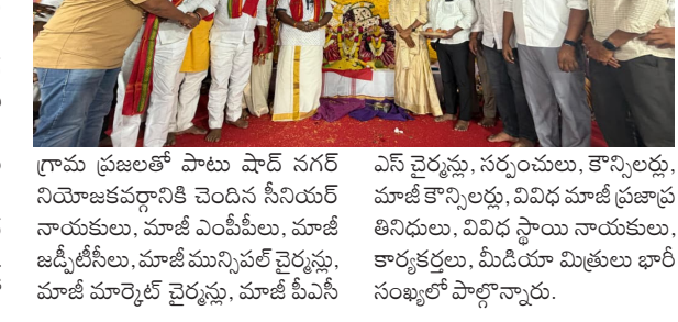
గ్రామ ప్రజలతో పాటు షాద్ నగర్