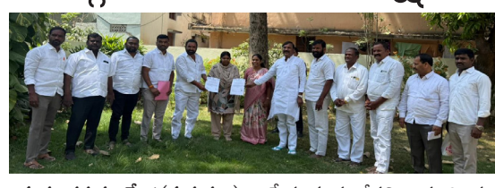
రామచంద్రపూర్ మే 1 (పుడయం)