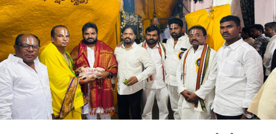
సాగాలని ఆయన ఈ సందర్భంగా

శంకర్ పల్లి, మే 01 (పుడయం) వైకేసీ పురి డివిజన్ పరిధిలోని శ్రీశ్రీ (కోసగండ్ల) పణిగిరి లక్ష్మీ నరసింహ స్వామి దేవస్థానంలో గురువారం లక్ష్మీ నరసింహ స్వామి వారి జయంతిని పురస్కరించుకొని జయంతి కళ్యాణ మహోత్సవాన్ని భక్తి శ్రద్ధలతో పునంగా నిర్వహించారు. ఈ సందర్భంగా ఆలయంలో ప్రత్యేకంగా అలంకరించి, పూజా కార్యక్రమాలను వైభవంగా నిర్వహించడంతో భక్తులు పెద్ద సంఖ్యలో తరలివచ్చి స్వామివారి దర్శనం చేసుకొని తీర్థ ప్రసాదాలు స్వీకరించారు. ఈ కార్యక్రమంలో గురువారం లక్ష్మీ నరసింహ స్వామి వారి జయంతిని పురస్కరించుకొని జయంతి కళ్యాణ మహోత్సవాన్ని భక్తి శ్రద్ధలతో పునంగా నిర్వహించారు.