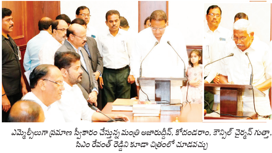
ఎమ్మెల్యేలుగా ప్రమాణ స్వీకారం చేస్తున్న మంత్రి అజారుద్దీన్, కోడండరాం, కౌన్సిల్ చైర్మన్ గుత్తా, సిఎం రేవంత్ రెడ్డిని కూడా చిత్రంలో చూడవచ్చు